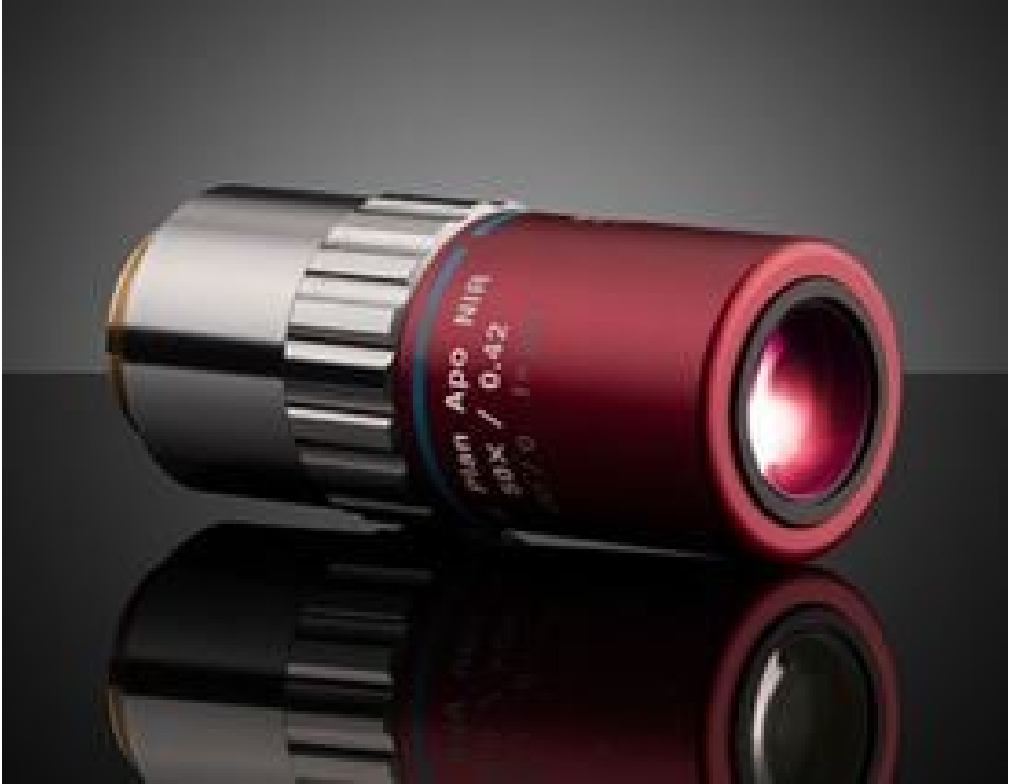
50X Mitutoyo Plan Apo NIR Infinity Corrected Objective, #46-405