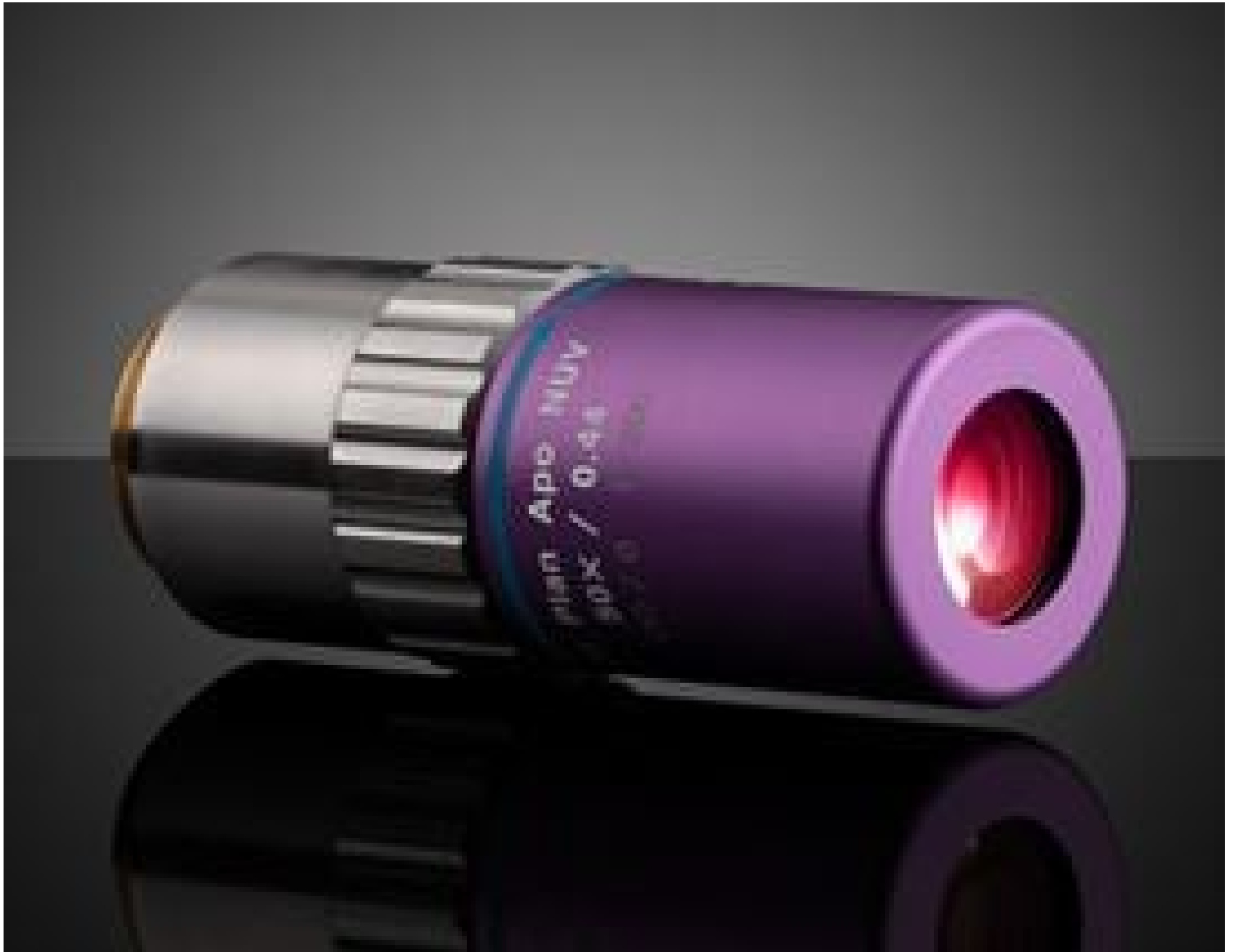
50X Mitutoyo Plan Apo NUV Infinity Corrected Objective, #46-408