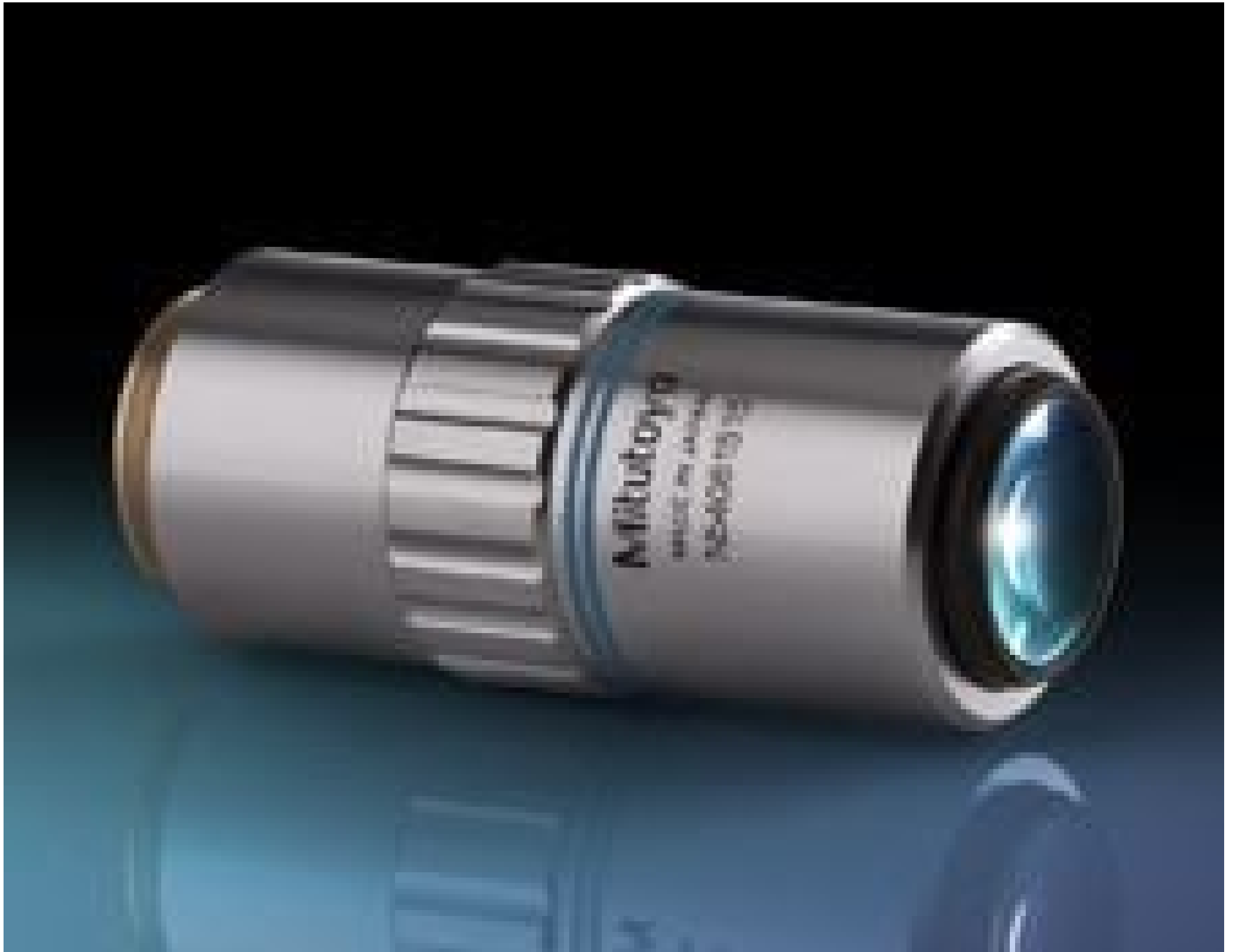
50X Mitutoyo Plan Apo SL Infinity Corrected Objective, #46-399