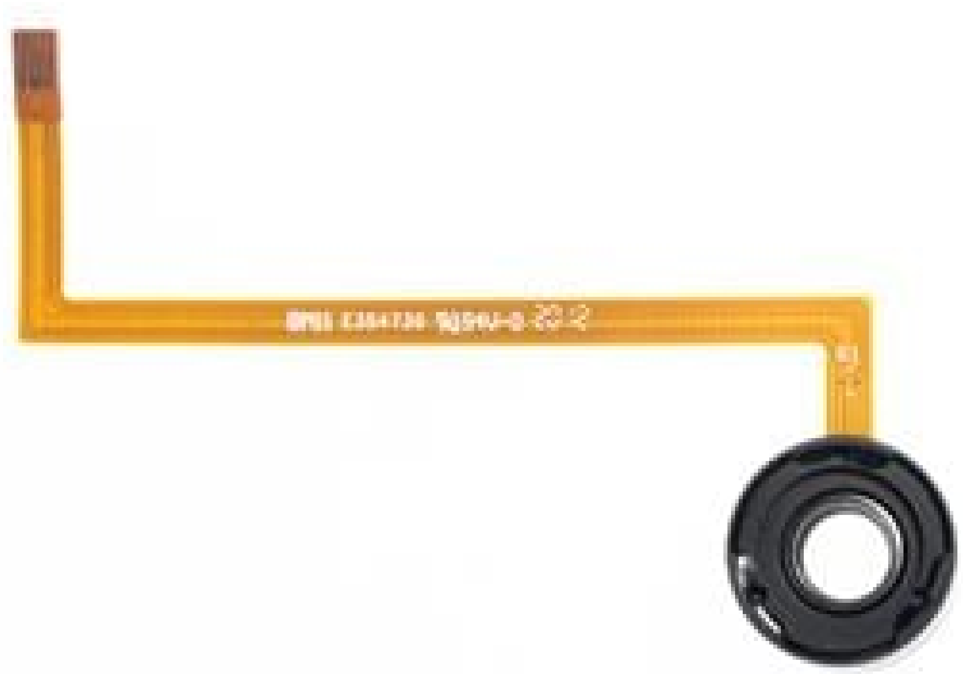
5.8mm CA, NIR Coated, A-58N1-P20 Corning® Varioptic® Variable Focus Liquid Lens, Packaged A-Series - 6 pins FPC with Thermistor