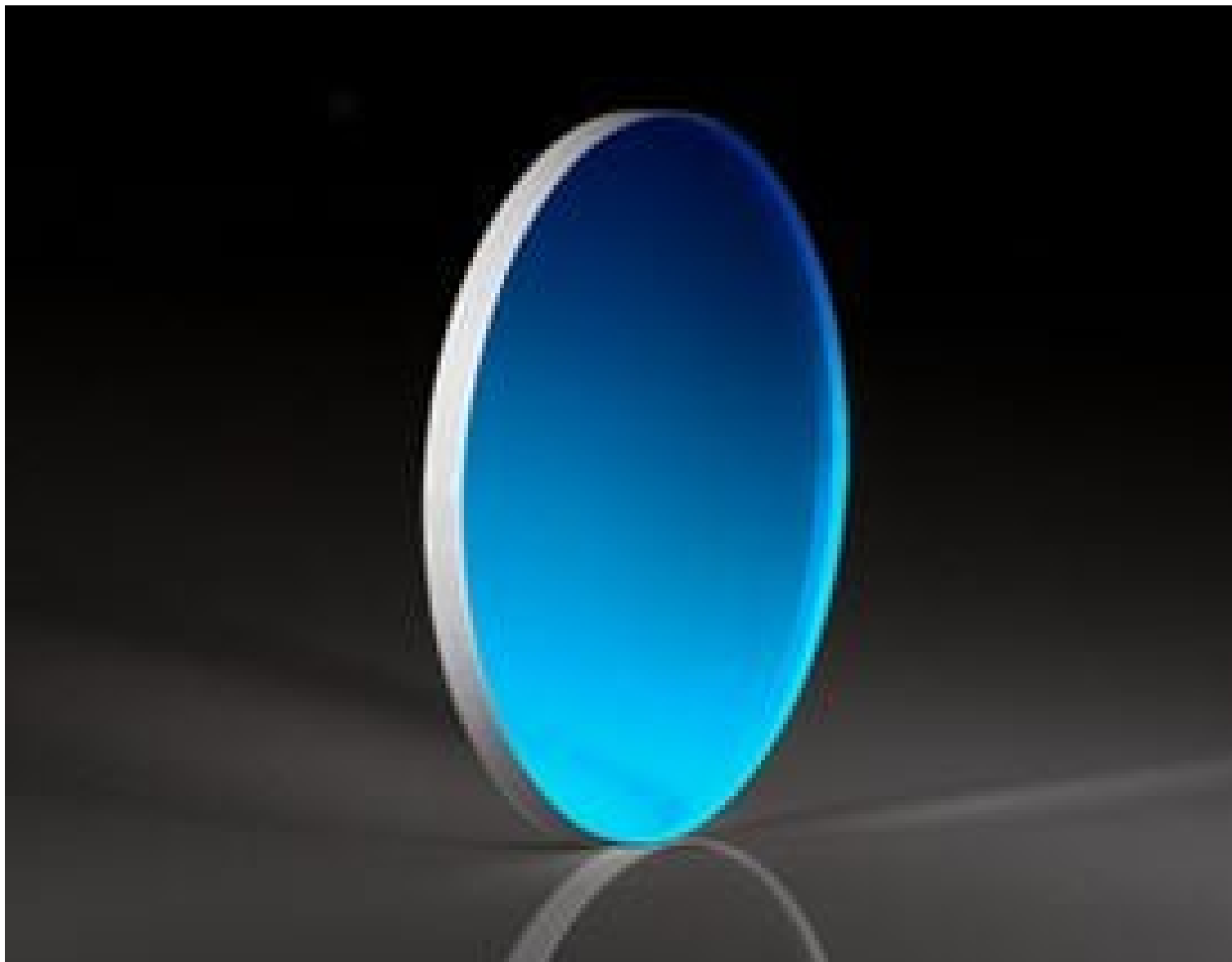
Uncoated \lambda/20 Fused Silica Window