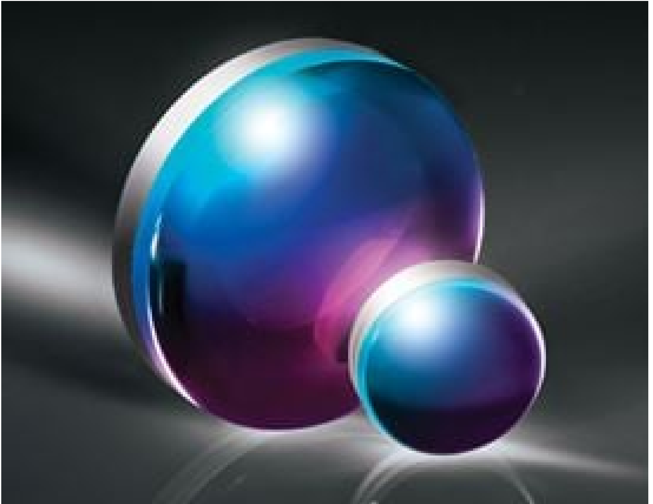
YAG-BBAR Coated Double-Convex (DCX) Lenses