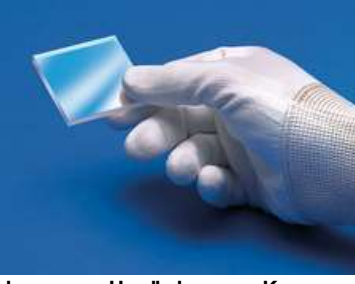
Werkzeuge zur Handhabung von Komponenten

Diese Optiken erfordern eine spezielle Behandlung, um Schäden zu vermeiden und eine lange Lebensdauer zu garantieren. Eine korrekte Handhabung, Reinigung und Lagerung sind für die optische Qualität extrem wichtig. In unserem Wissens-Zentrum finden Sie eine Schritt-für-Schritt-Anleitung zur Optikreinigung und Erklärungen zu bewährten Verfahren. Wenn Sie weitere Unterstützung benötigen, senden Sie uns gerne jederzeit eine E-Mail oder chatten Sie mit unserem technischen Support.