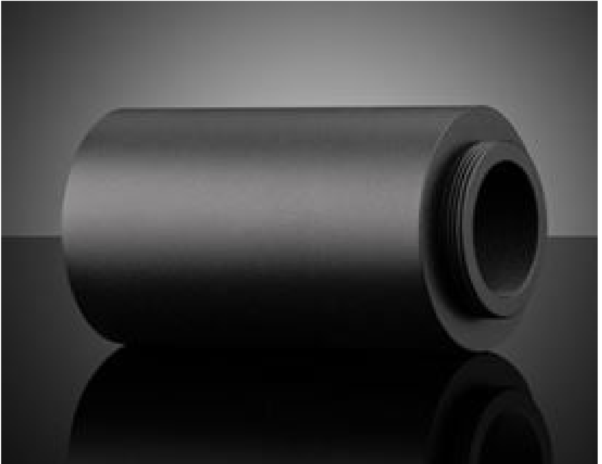
#23-901, 5X, 95mm, C-Mount Parfocal Adapter