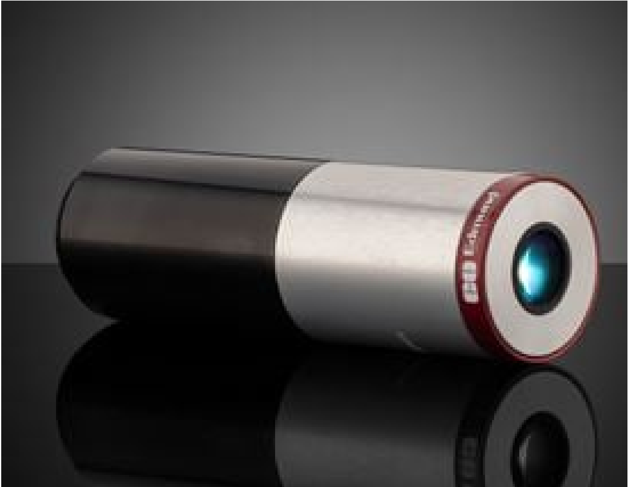
#88-353: 5X Cf Objective