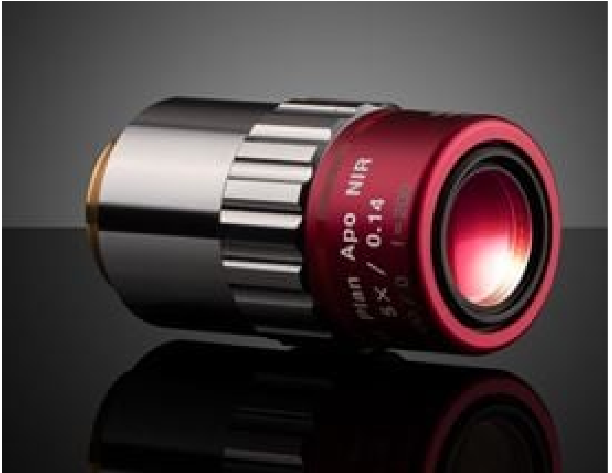
5X Mitutoyo Plan Apo NIR Infinity Corrected Objective, #46-402