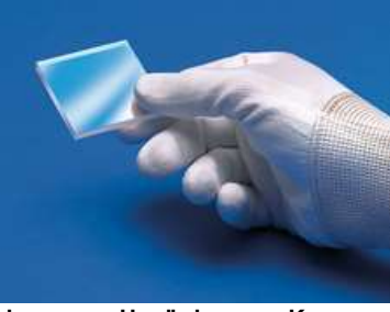
Werkzeuge zur Handhabung von Komponenten

Diese Optiken erfordern eine spezielle Behandlung, um Schäden zu vermeiden und eine lange Lebensdauer zu garantieren. Eine korrekte Handhabung, Reinigung und Lagerung sind für die optische Qualität extrem wichtig. In unserem Wissens-Zentrum finden Sie eine Schritt-für-Schritt-Anleitung zur Optikreinigung und Erklärungen zu bewährten Verfahren. Wenn Sie weitere Unterstützung benötigen, senden Sie uns gerne jederzeit eine E-Mail oder chatten Sie mit unserem technischen Support.