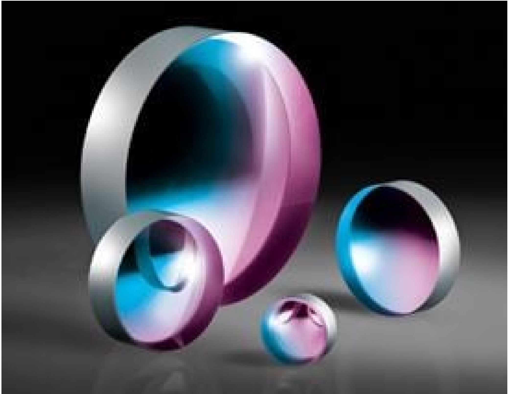
UV Fused Silica Plano-Concave (PCV) Lenses