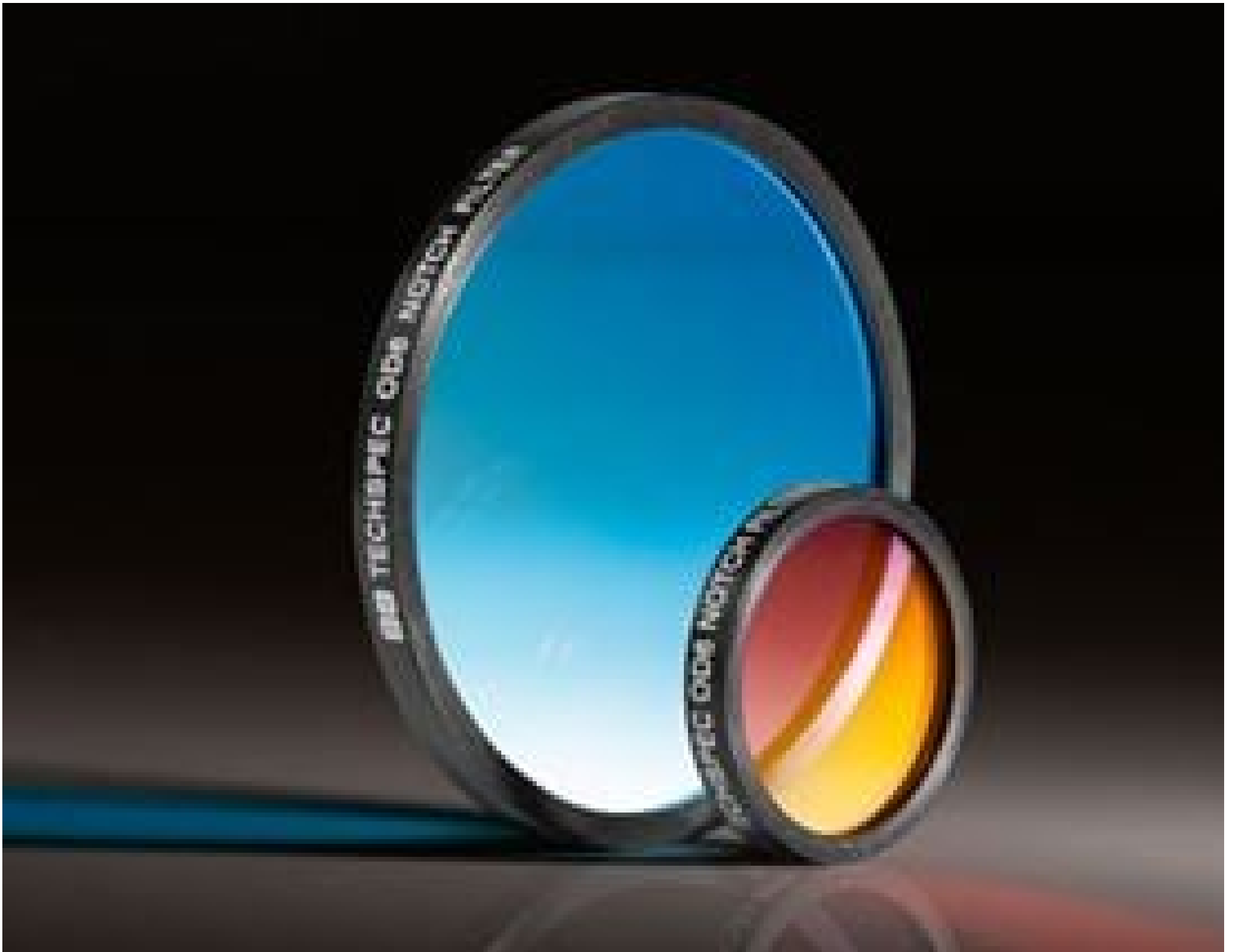
TECHSPEC OD 6.0 Notch Filters