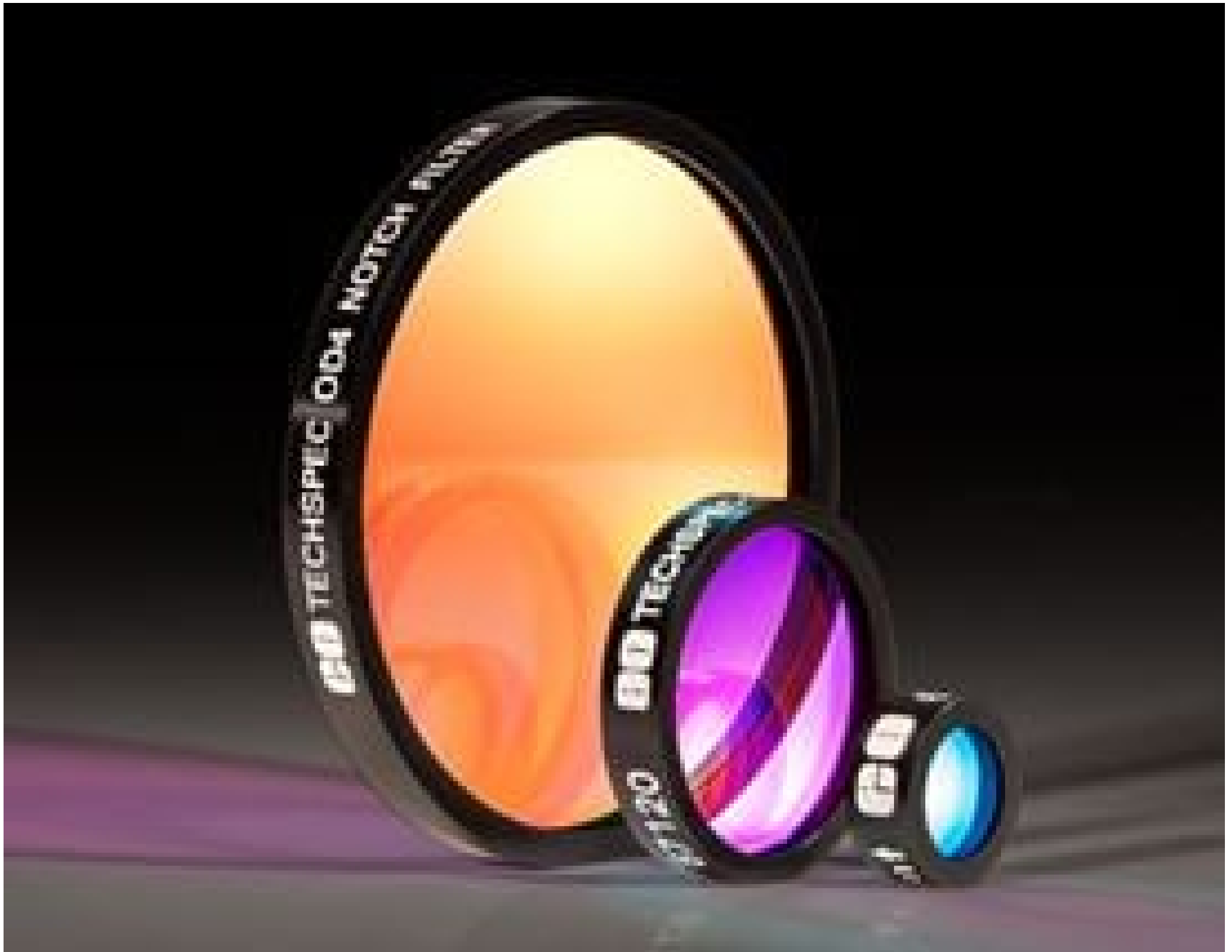
TECHSPEC OD 4.0 Notch Filters