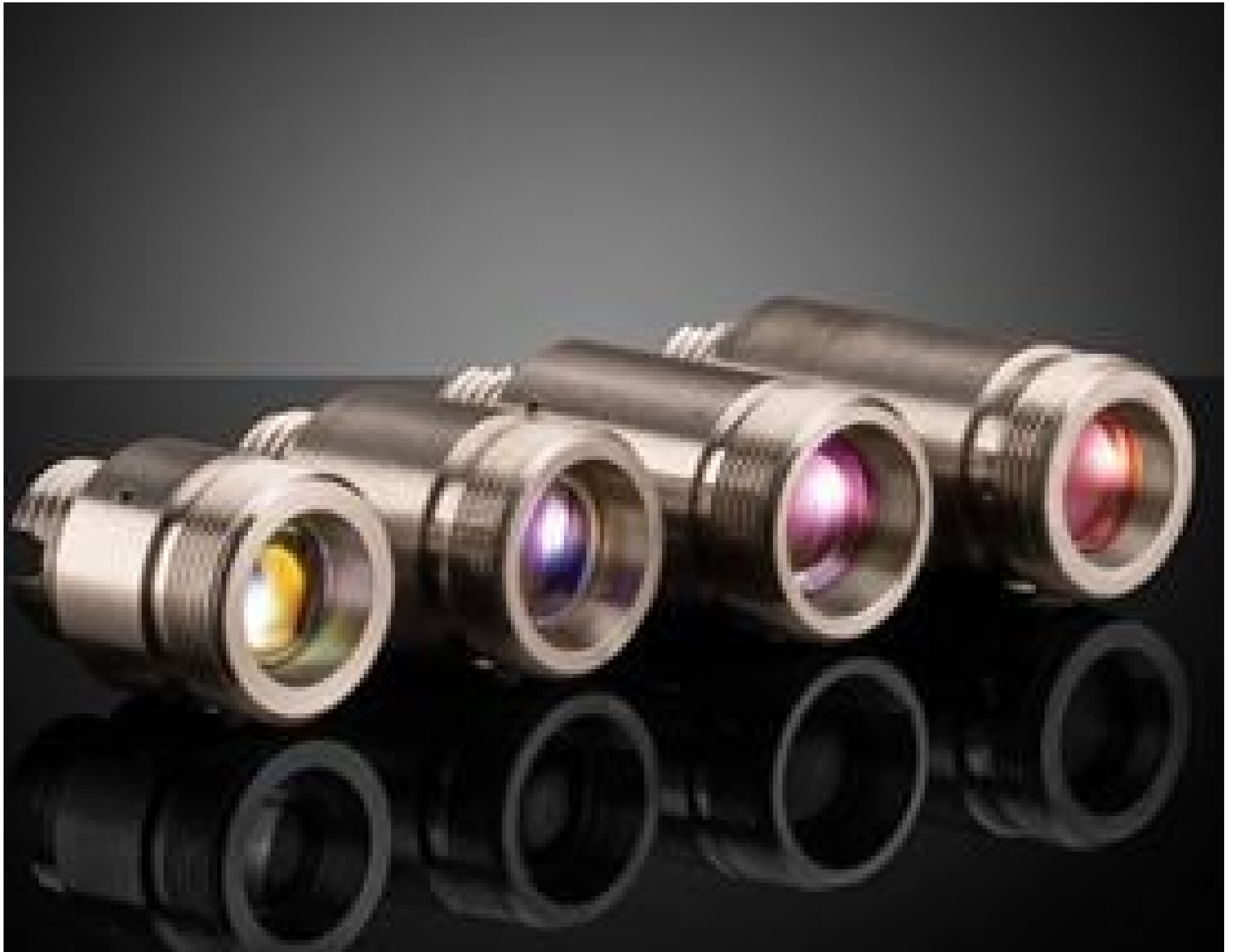
Fiber Optic Collimator and Focuser Assemblies