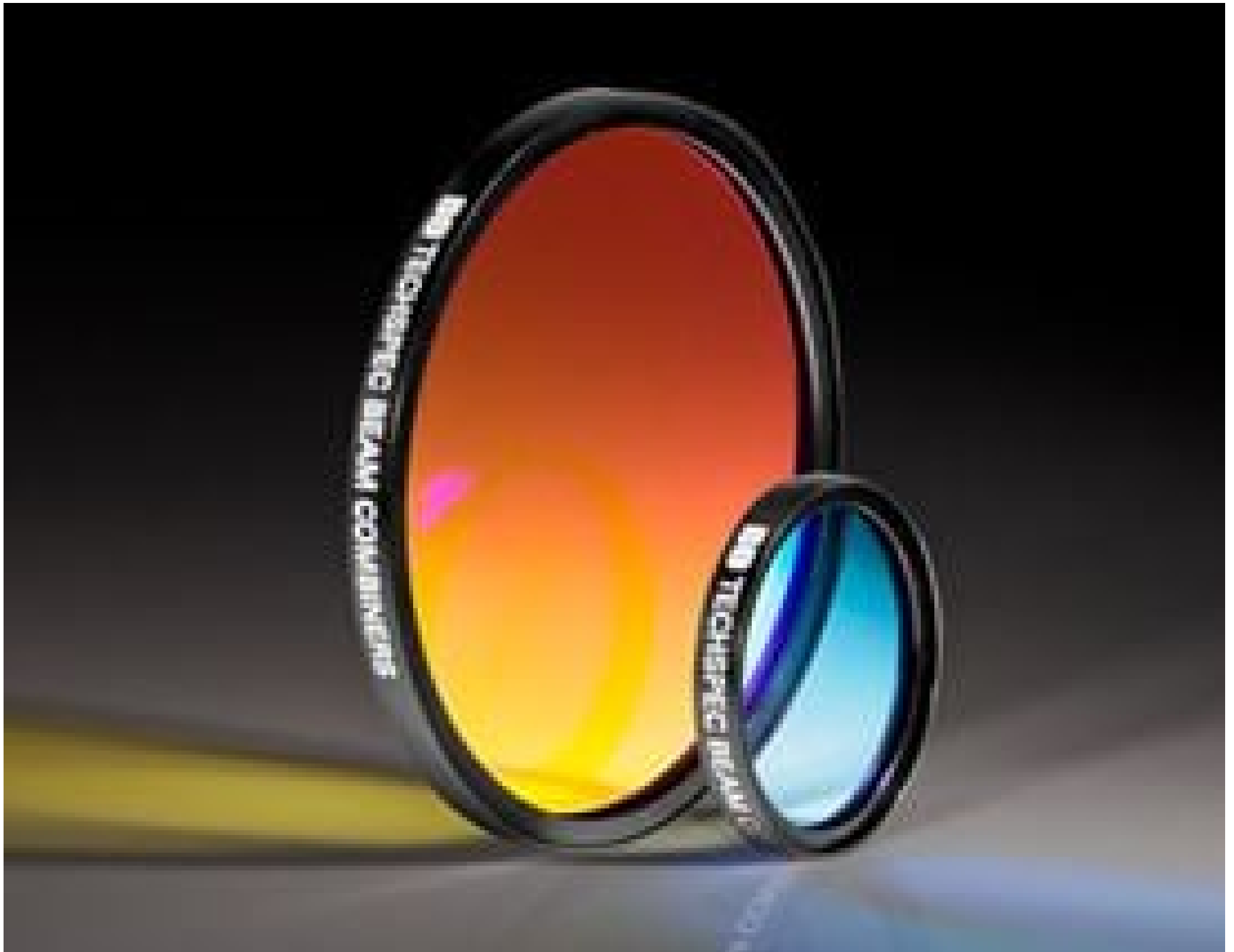
TECHSPEC® Dichroic Laser Beam Combiners