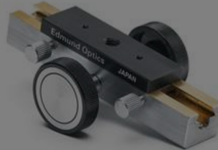
#36-347 - Kleine präzise Bühne für eine Achse, 40 mm Verstellweg €273,00