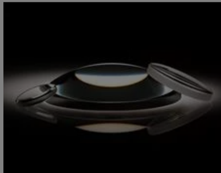
#47-337 - Plankonvexe Linse, 12 mm D. x 54 mm BW, VIS-0°-beschichtet €47,50