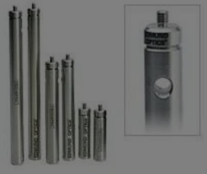
Edelstahlstangen mit metrischen Maßen