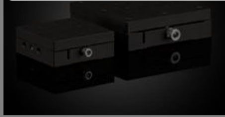
Schwalbenschwanzbühnen mit hoher Belastbarkeit