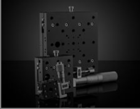
Einachsige Bühnen mit Kreuzrollenlager (Modell ohne Durchbohrung)