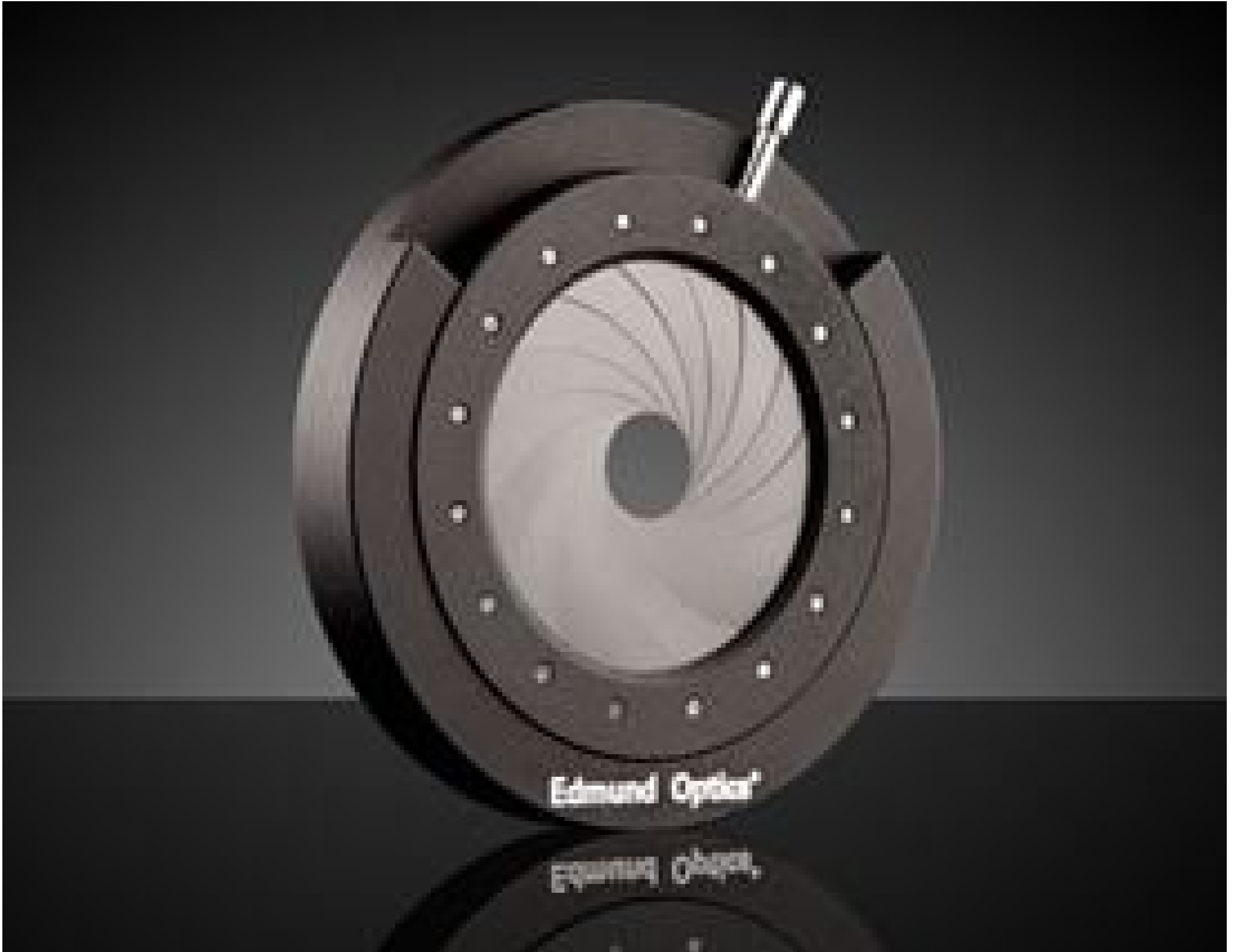
66mm Outer Diameter, Mounted Iris Diaphragm, #53-916