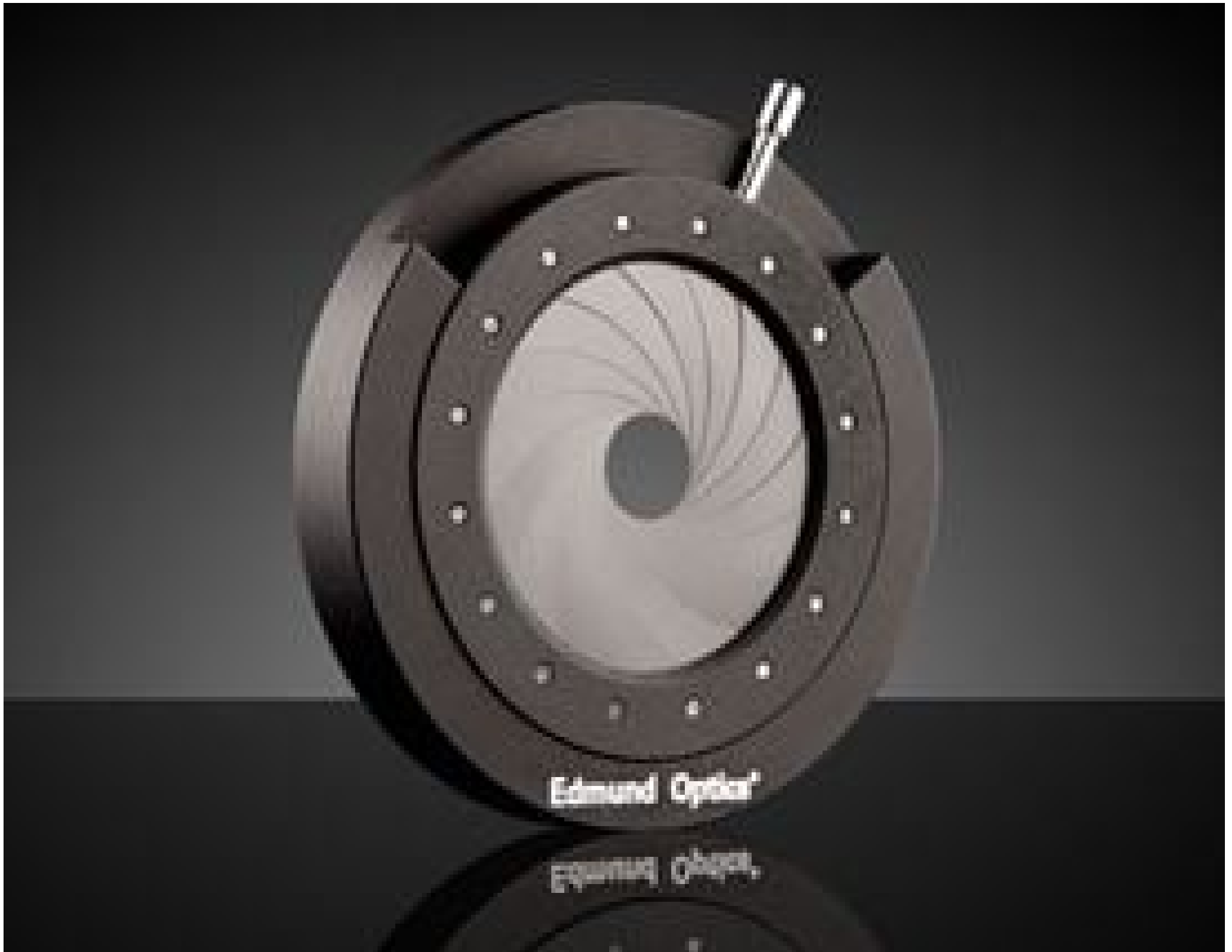
66mm Outer Diameter, Mounted Iris Diaphragm, #53-916