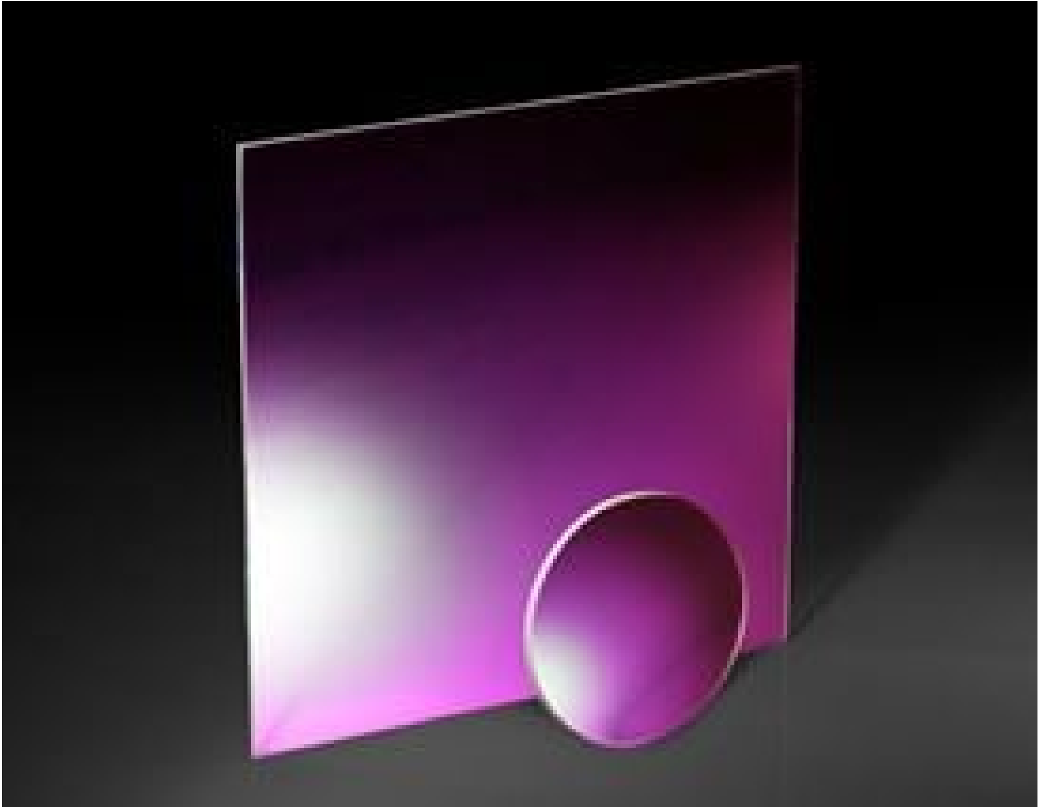
EAGLE XG® Windows