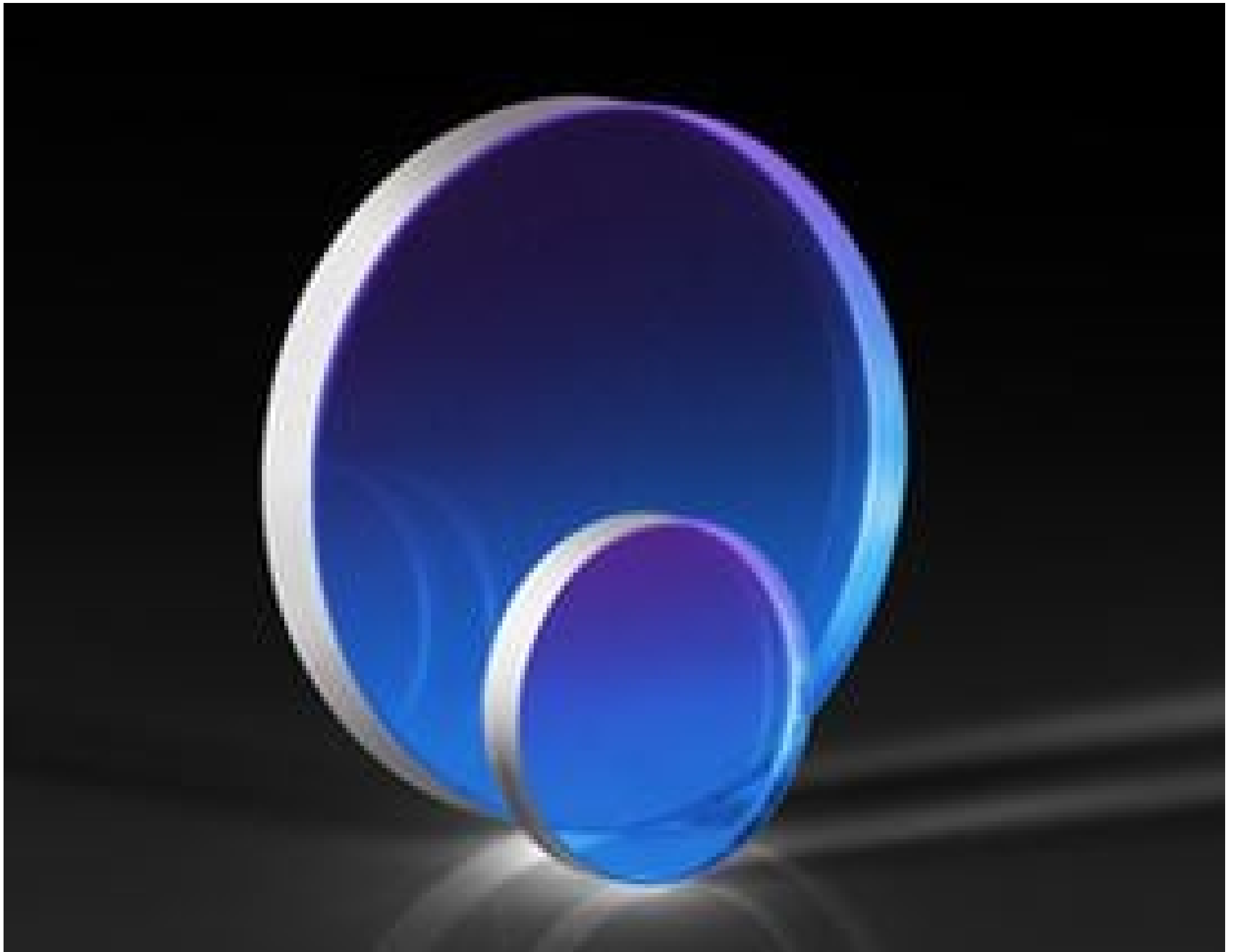
Magnesium Fluoride (MgF 2 ) Windows