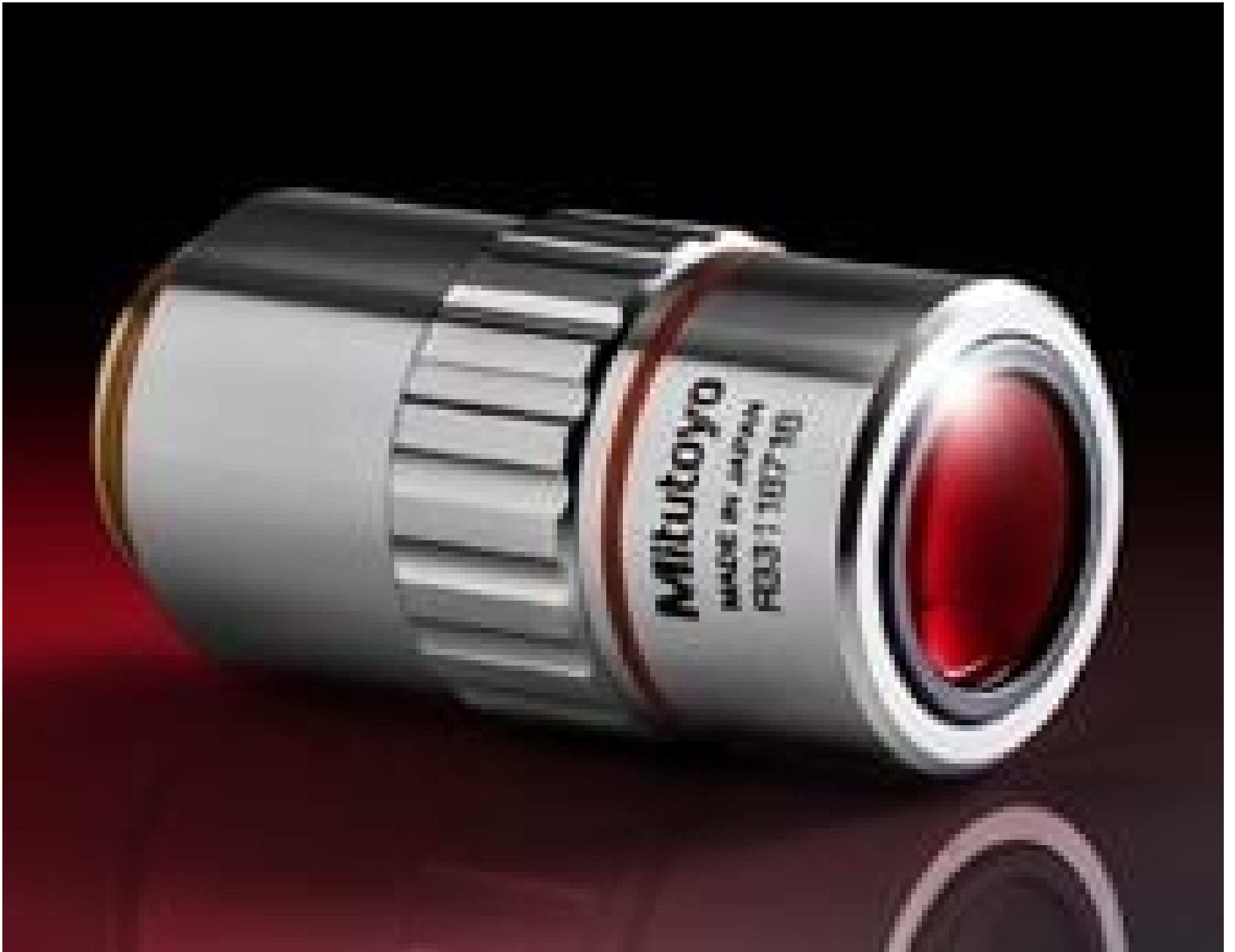
7.5X Mitutoyo Plan Apo Infinity Corrected Long WD Objective, #66-383