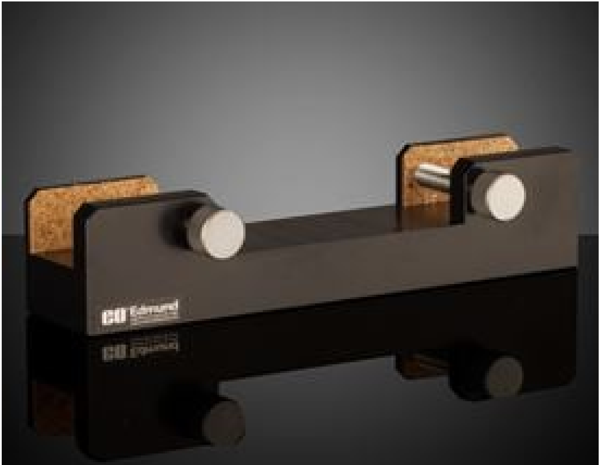
80mm Sq., Fixed Filter Holder