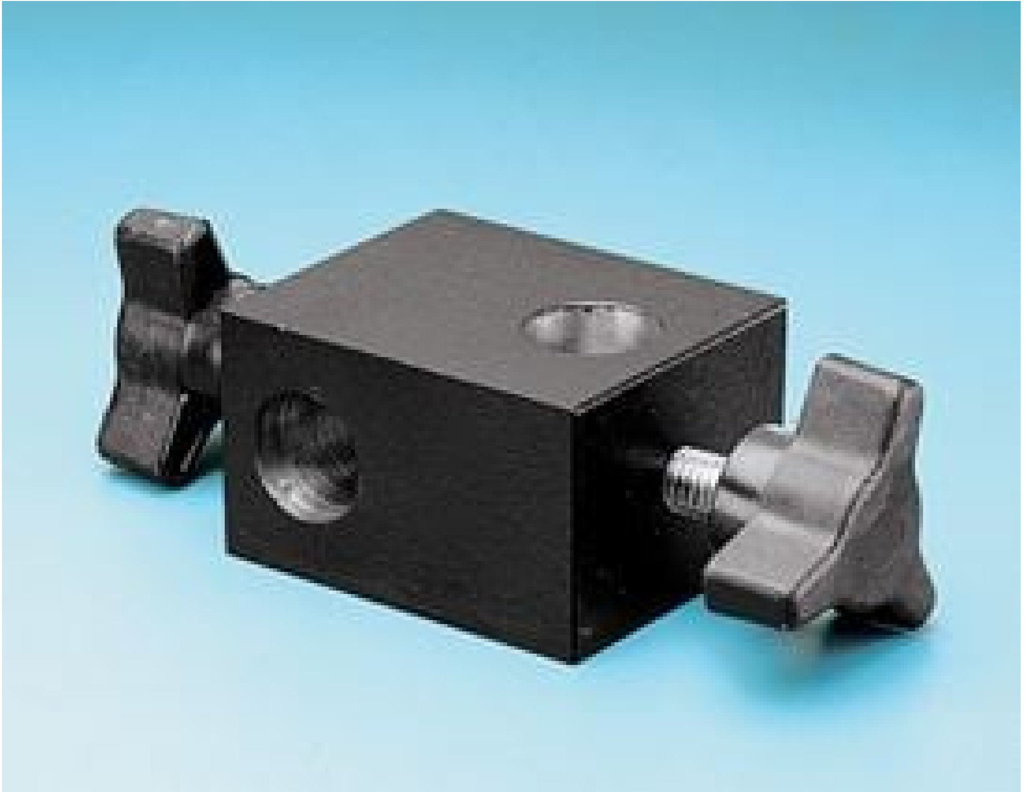
#39-355 90° Angle Mount