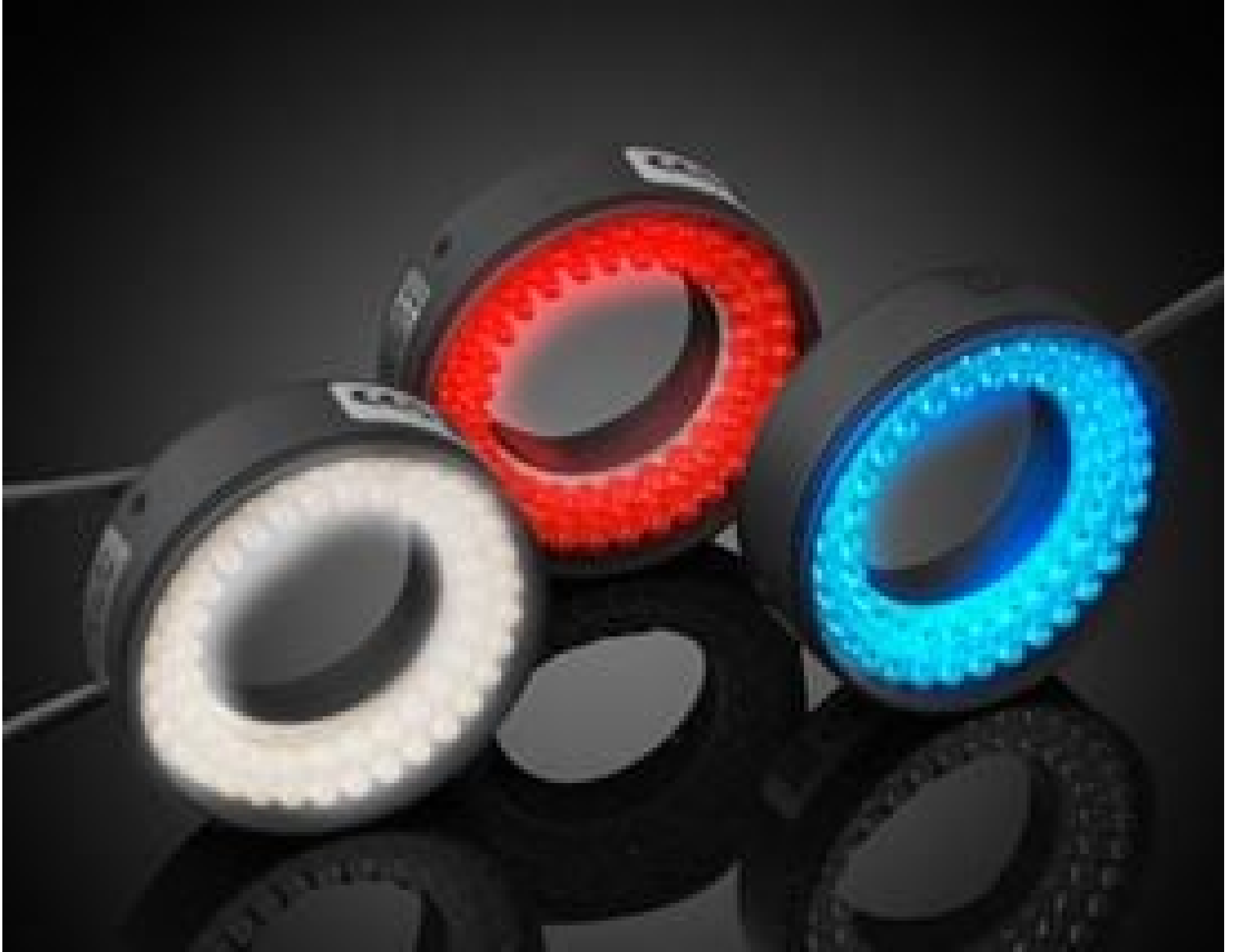
CCS High-Angle LED Ring Lights