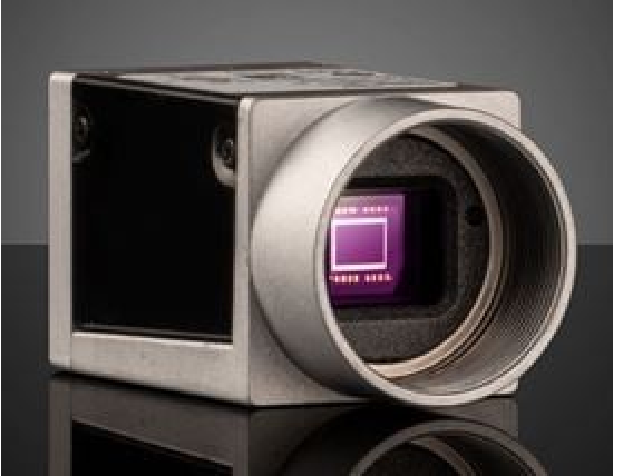
Basler ace GigE Cameras