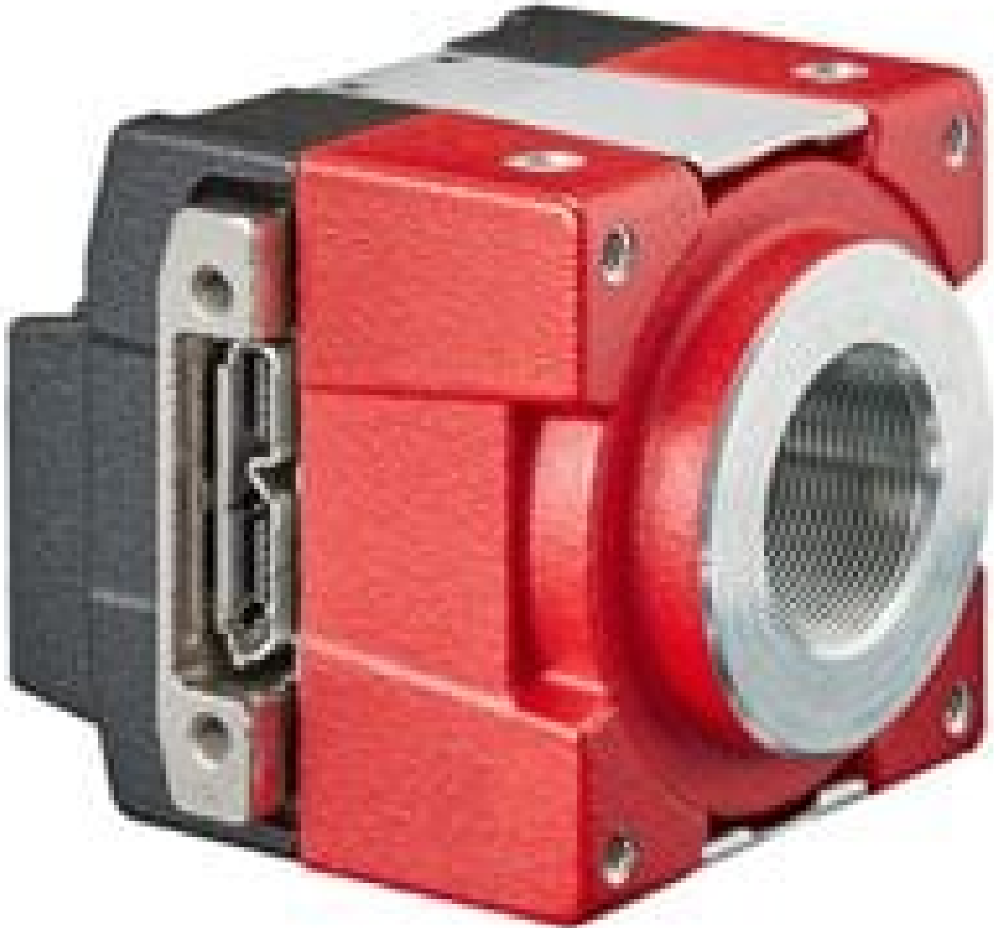
Allied Vision Alvium Camera, Full Housing, S-Mount, Right Angle IO Port (Front)