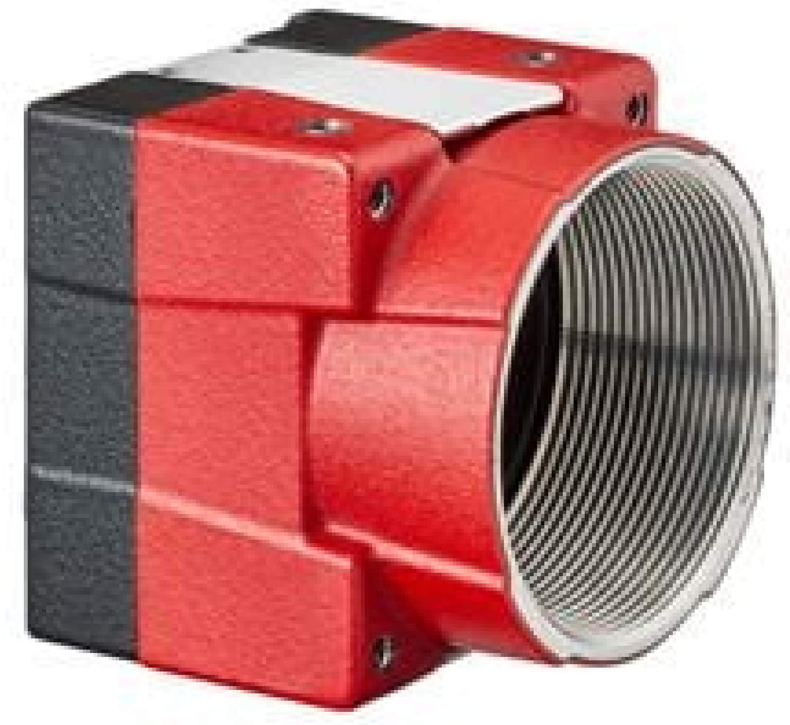
Allied Vision Alvium Camera, Full Housing (Front)