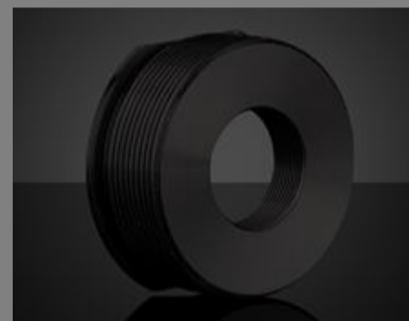
#23-979 - Adapter C- auf S-Mount €38,00