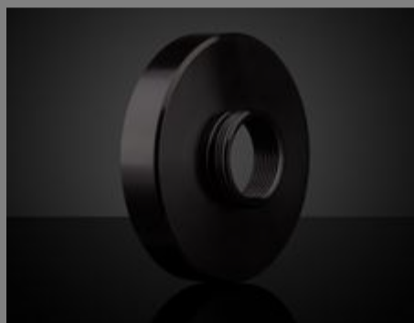
#63-974 - Adapter Außengewinde S-Mount, Innengewinde C-Mount €62,50