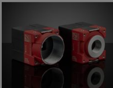
#23-539 - Allied Vision Alvium GigE-Kamera mit PoE, G1-158m, 1/2,9", 1,6 MP, S-Mount, monochrom €440,00