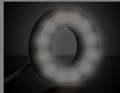
Beleuchtung für Bildverarbeitung