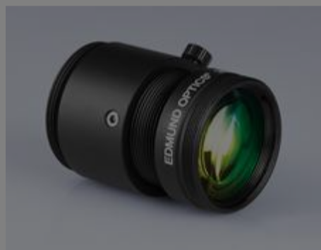
#85-367 - Objektiv mit Festbrennweite der Ci-Serie, 35 mm, f/8 €215,00