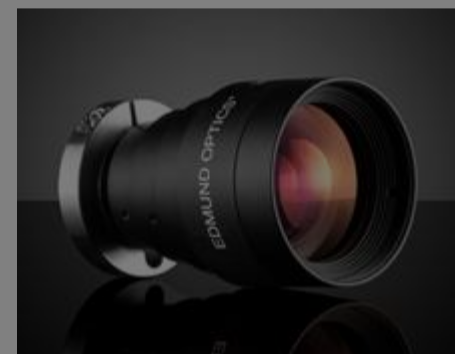
#36-530 - Objektiv mit Festbrennweite der HPr-Serie, 35 mm, f/8,0, 1,1" €725,00