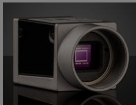
#35-916 - Basler ace acA2040- 35gc GigE-Kamera, Farbe €600,00