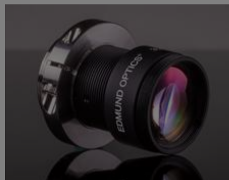
#35-186 - Objektiv mit Festbrennweite der Cr-Serie, 35 mm, f/8,0 €310,00