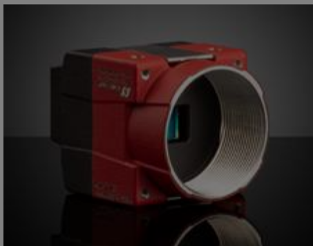
Allied Vision Alvium Kameraserie mit USB 3.0