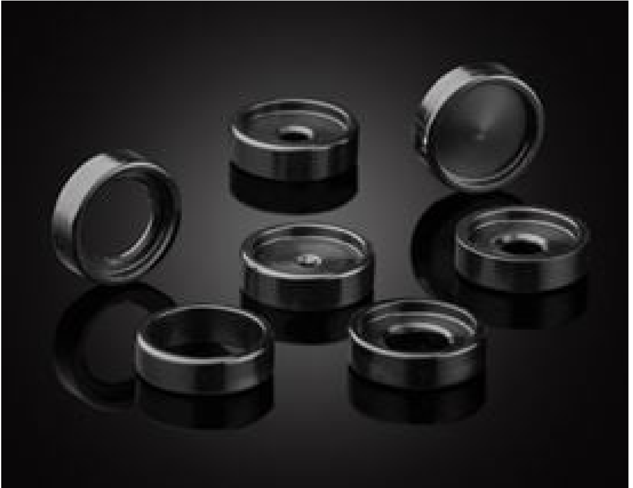
Aperture Kit for Achromat Prototyping Kit