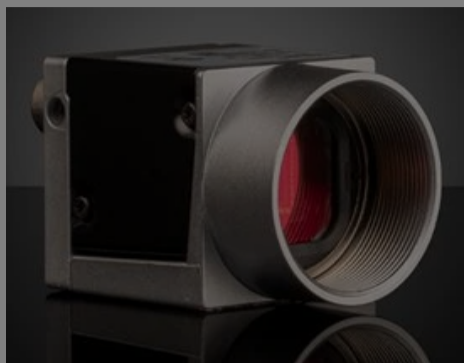
Basler ace USB 3.0 Cameras (Front)