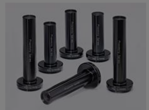
#33-973 - InfiniStix 3X 44mm WD Objektiv €1.020,00