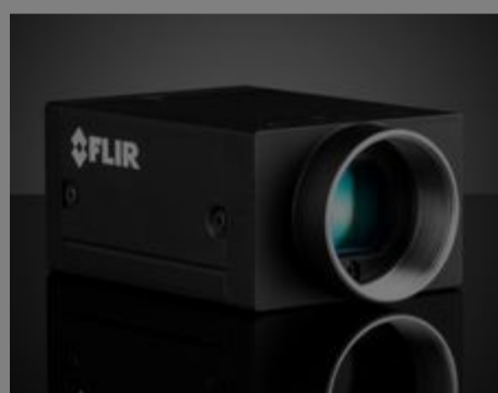
#88-607 - GS3-U3-23S6M-C 1/1,2" FLIR Grasshopper@3 USB 3.0 Hochleistungskamera, monochrom €1.180,00