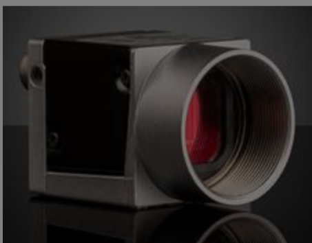
#33-976 - Basler ace acA800-510um USB-3.0-Kamera, monochrom €489,00