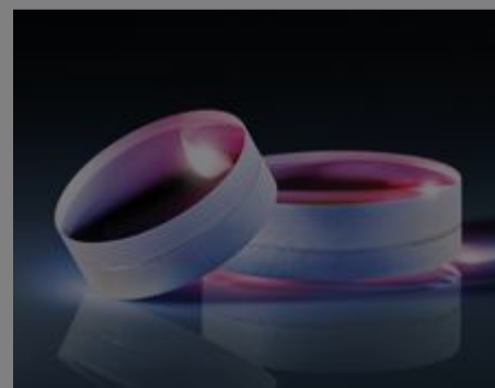
#32-500 - Achromat, 30 mm D. x 100 mm Brennweite, MgF 2 -beschichtet €145,00