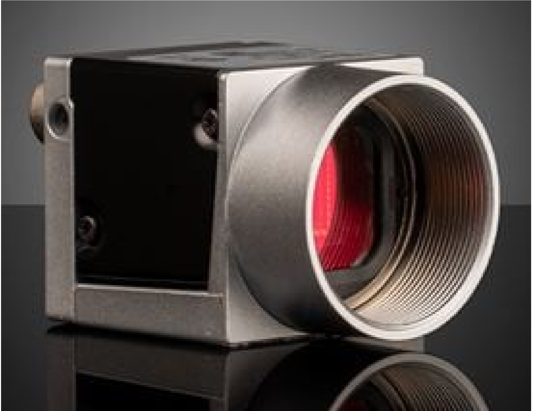
Basler ace USB 3.0 Cameras (Front)