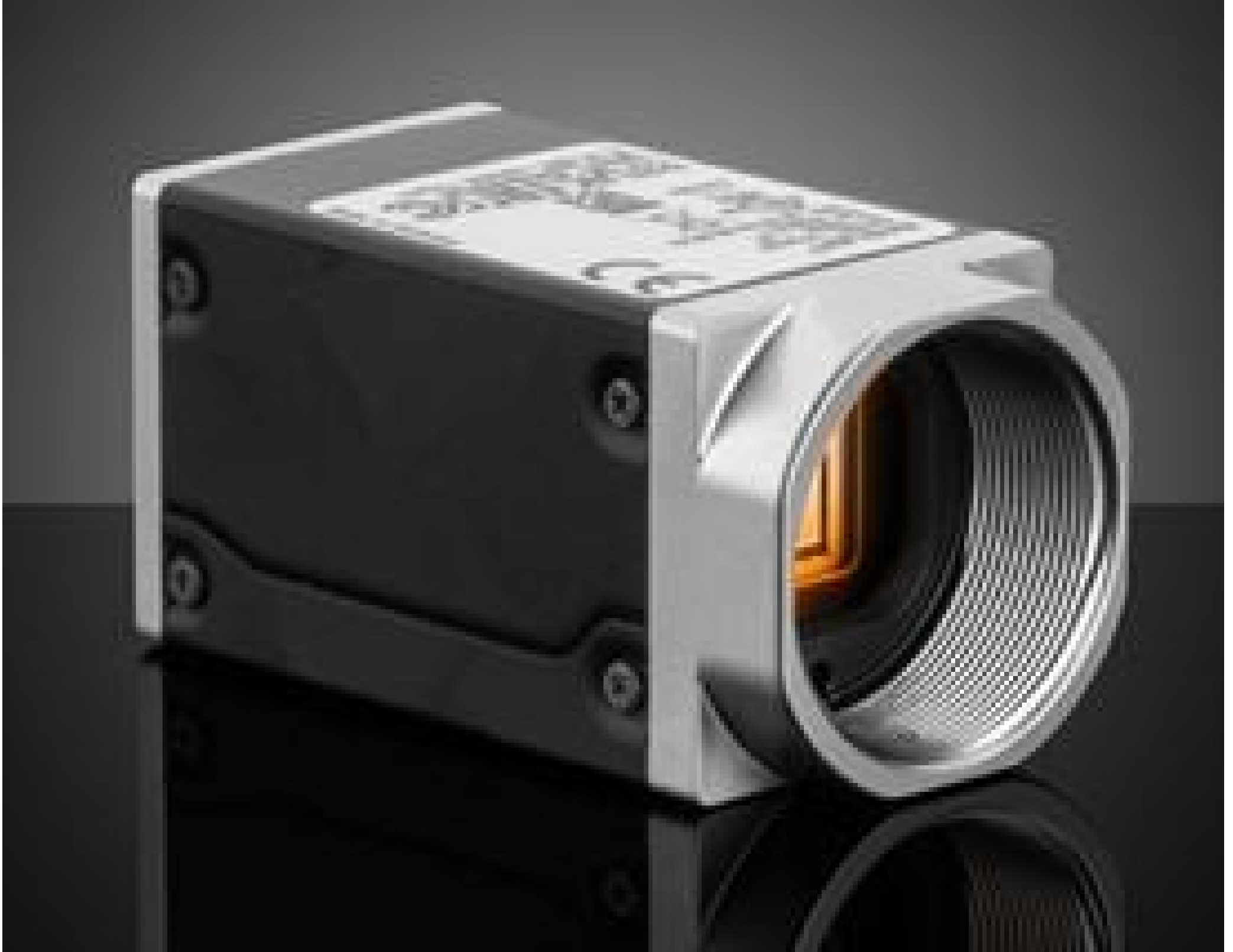
Basler ace2 Ultraviolet (UV) GigE Camera