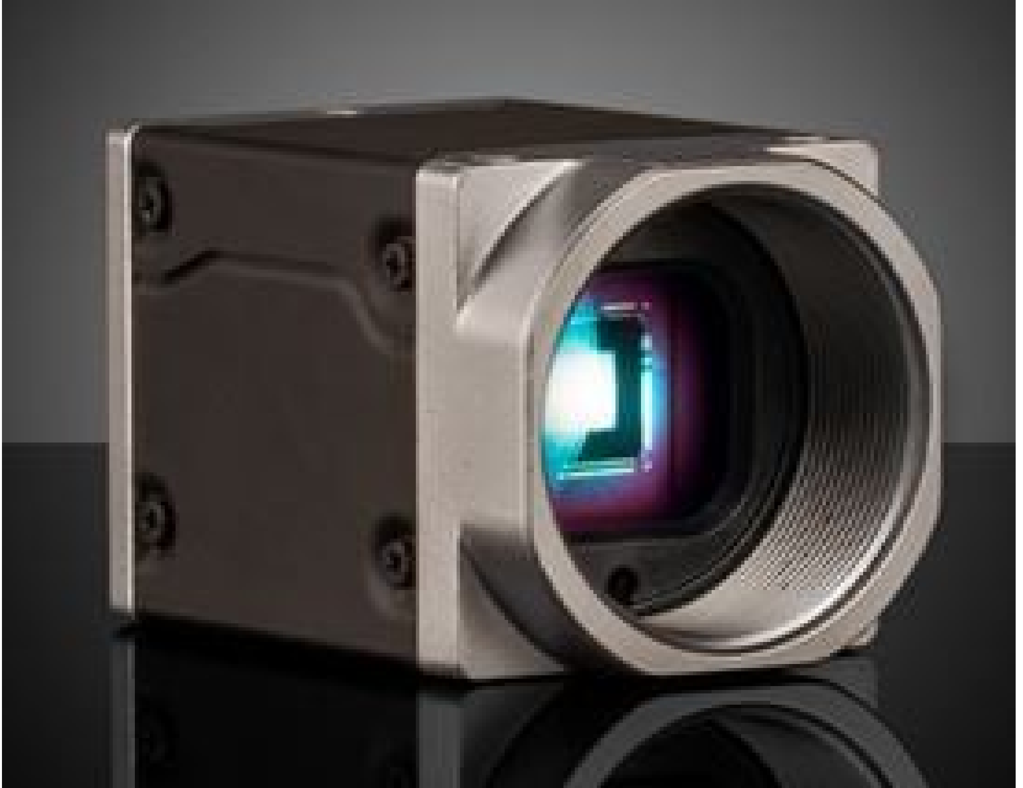
Basler ace2 USB 3.0 Cameras (Front)