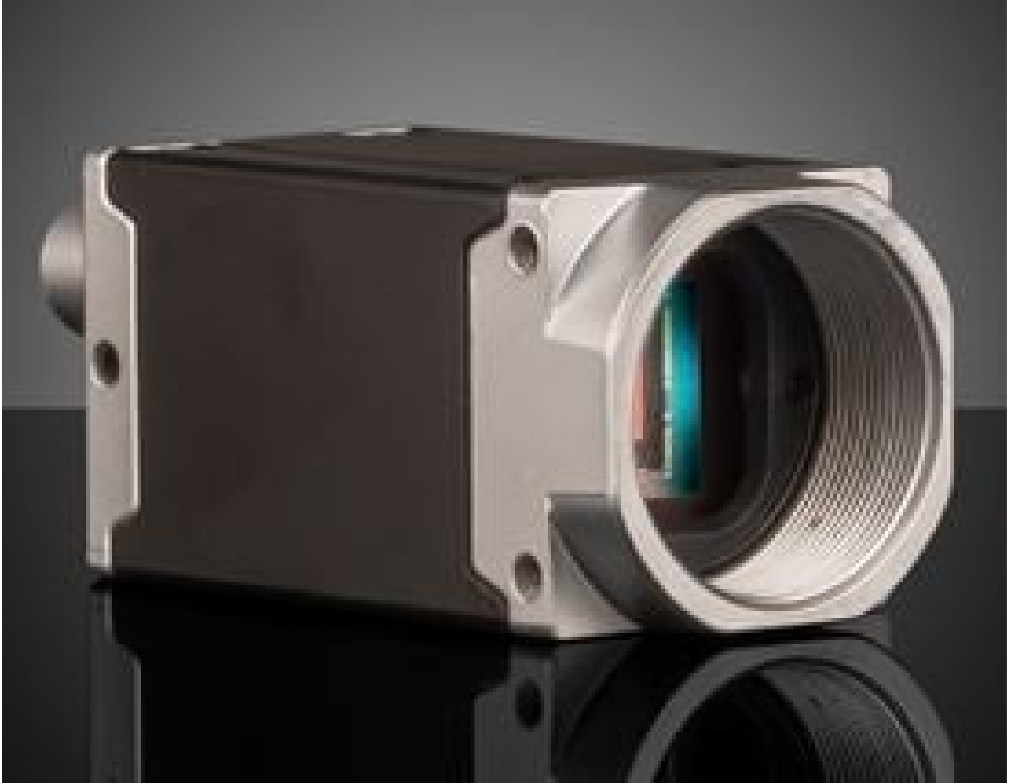
Basler ace2 GigE Cameras (Front)