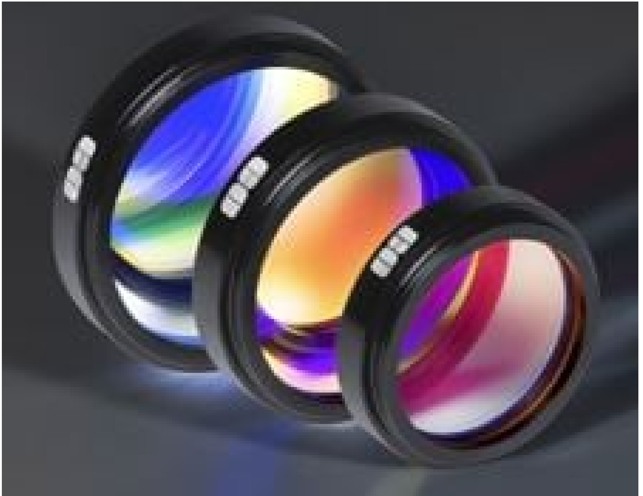
TECHSPEC® High Performance Mounted Machine Vision Filters