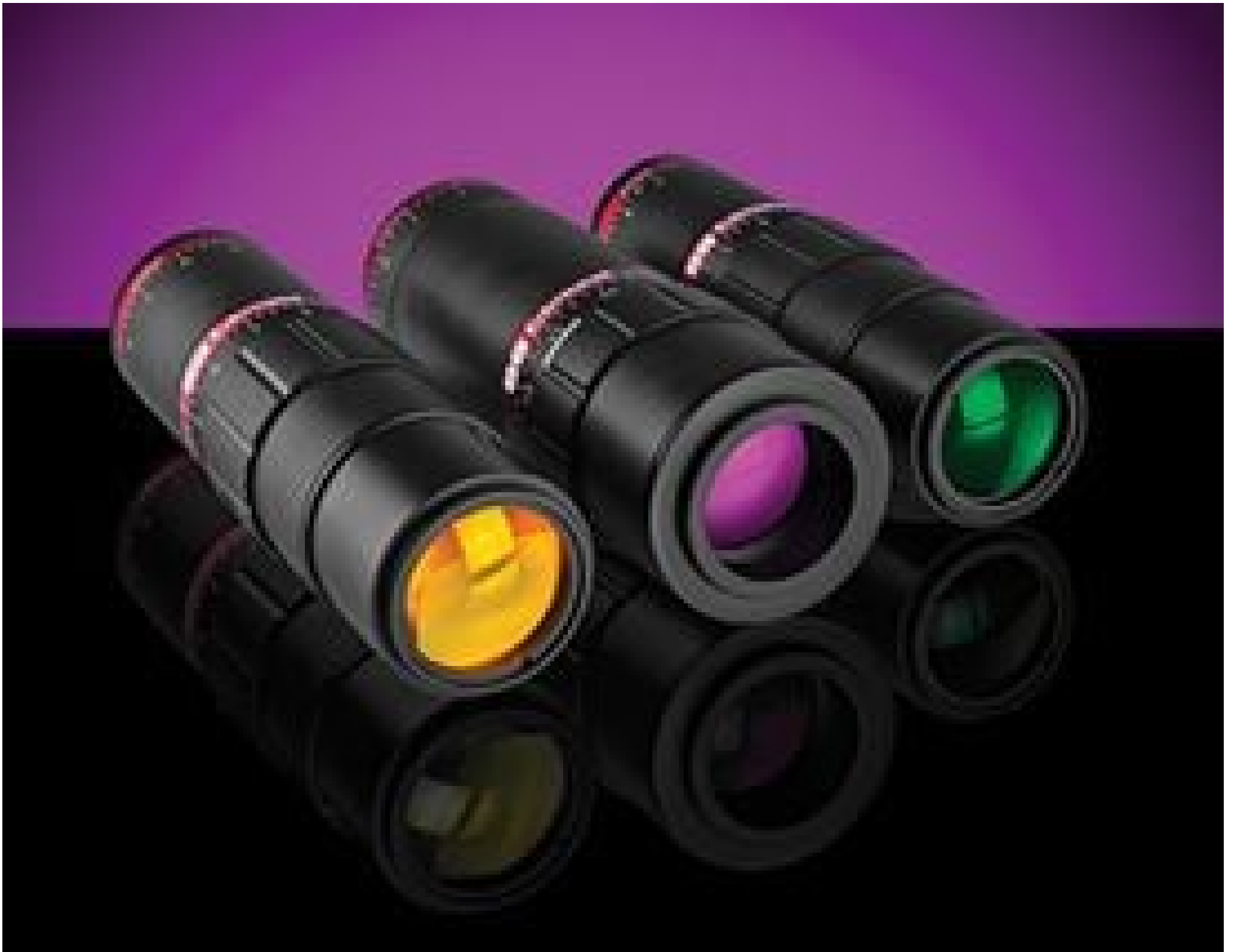
Research-Grade Variable Beam Expanders