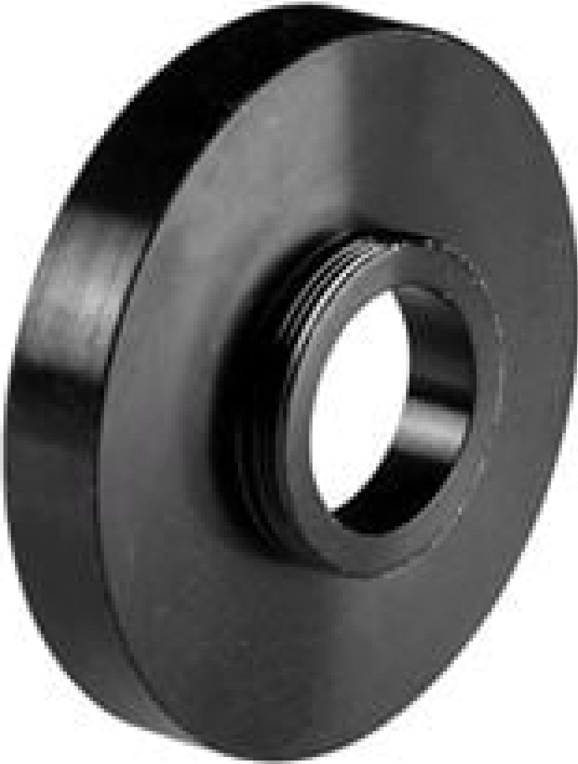
C-Mount Accessory Mount for #47-274, #56-869