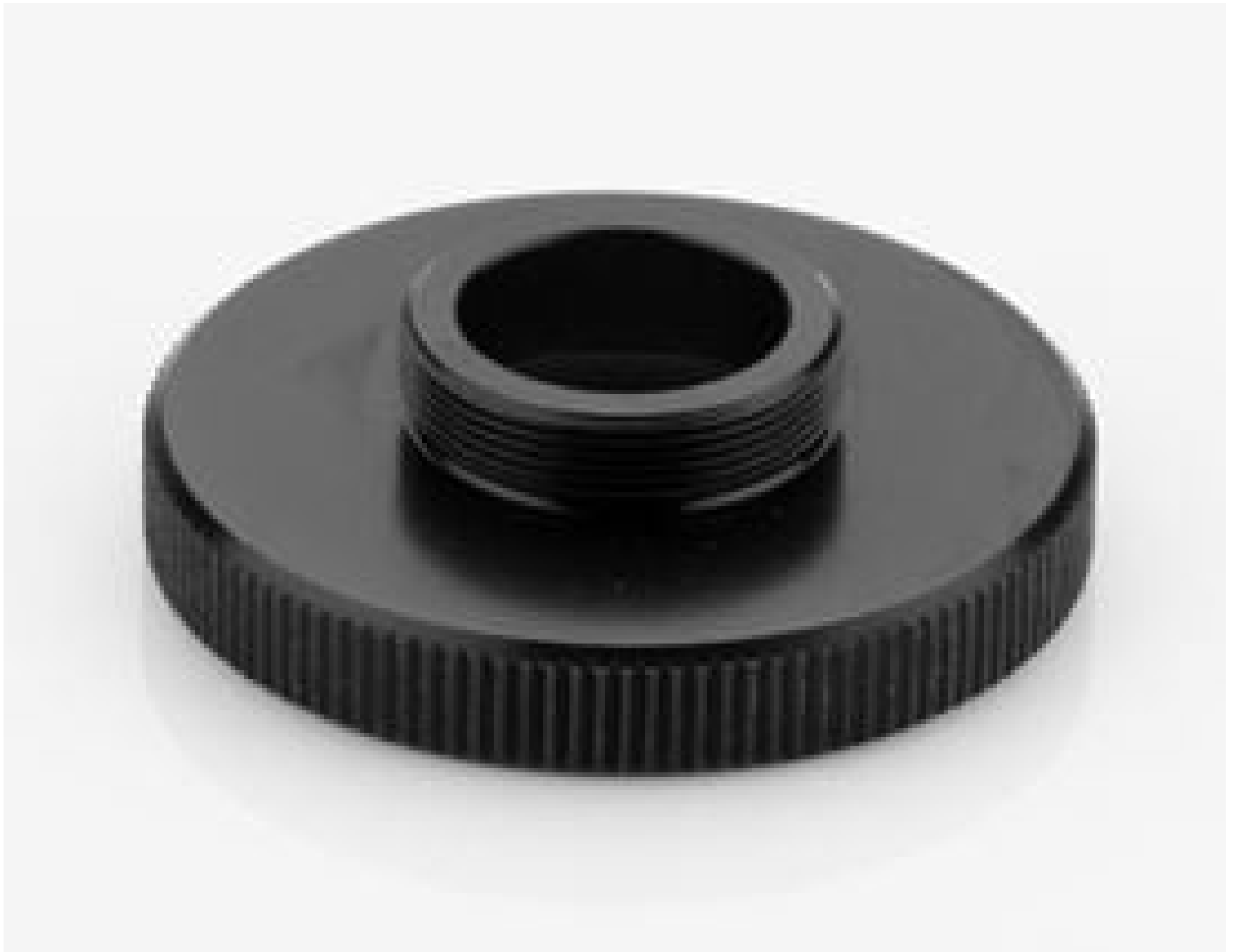
#58-184: C-Mount Adapter for 12 Position Filter Wheel and Assembly