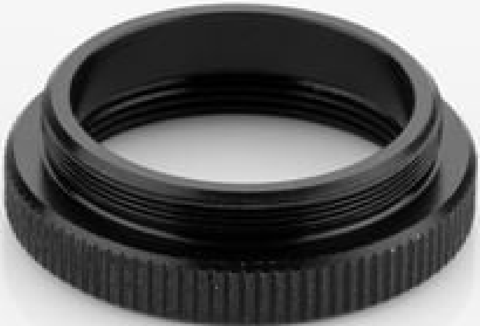
#56-784: C-Mount Adapter for 6 Position Filter Wheel and Assembly