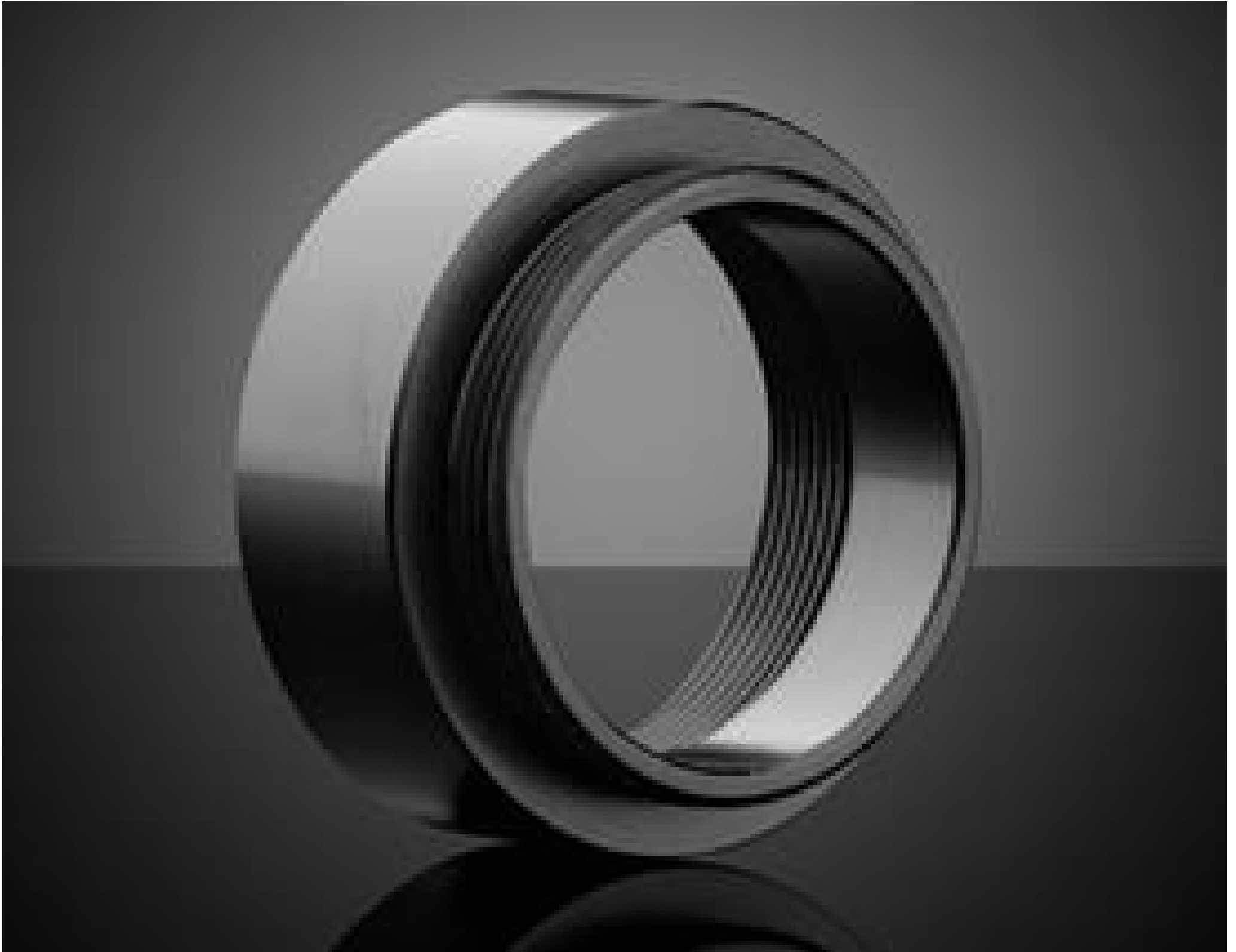
C-Mount to Nikon (M25) Adapter (#11-148)