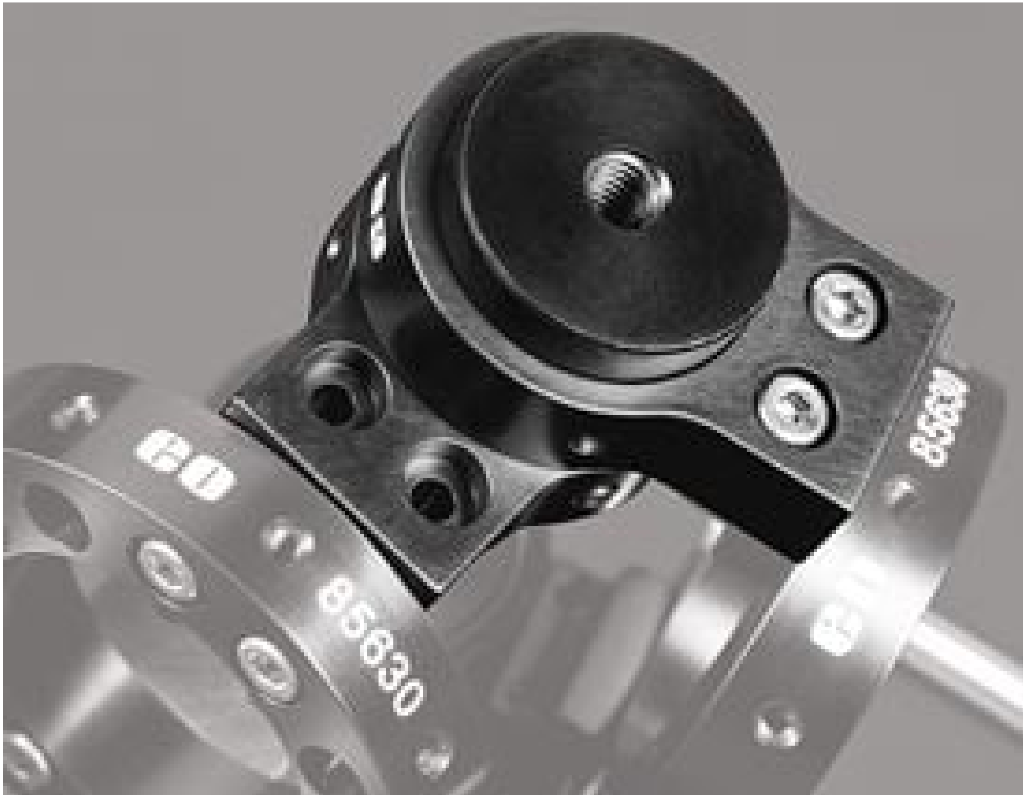
TECHSPEC® Swivel Joint Add-On Kit