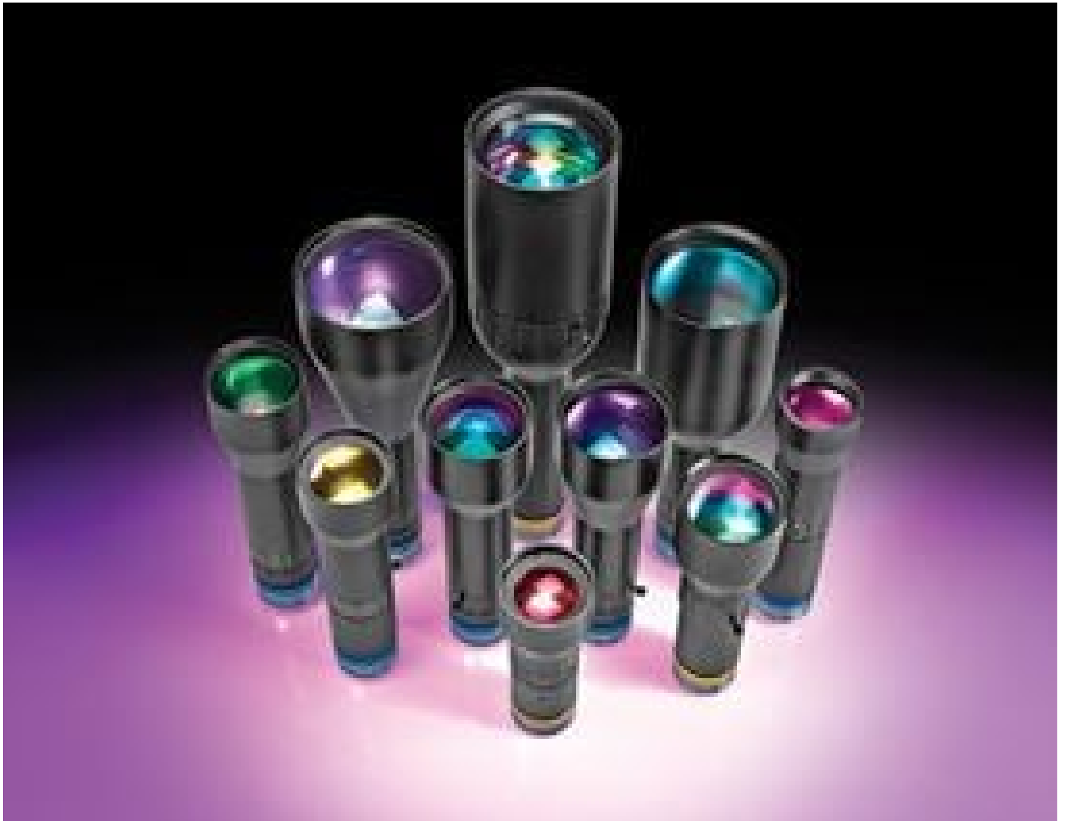
SilverTL™ Telecentric Lenses