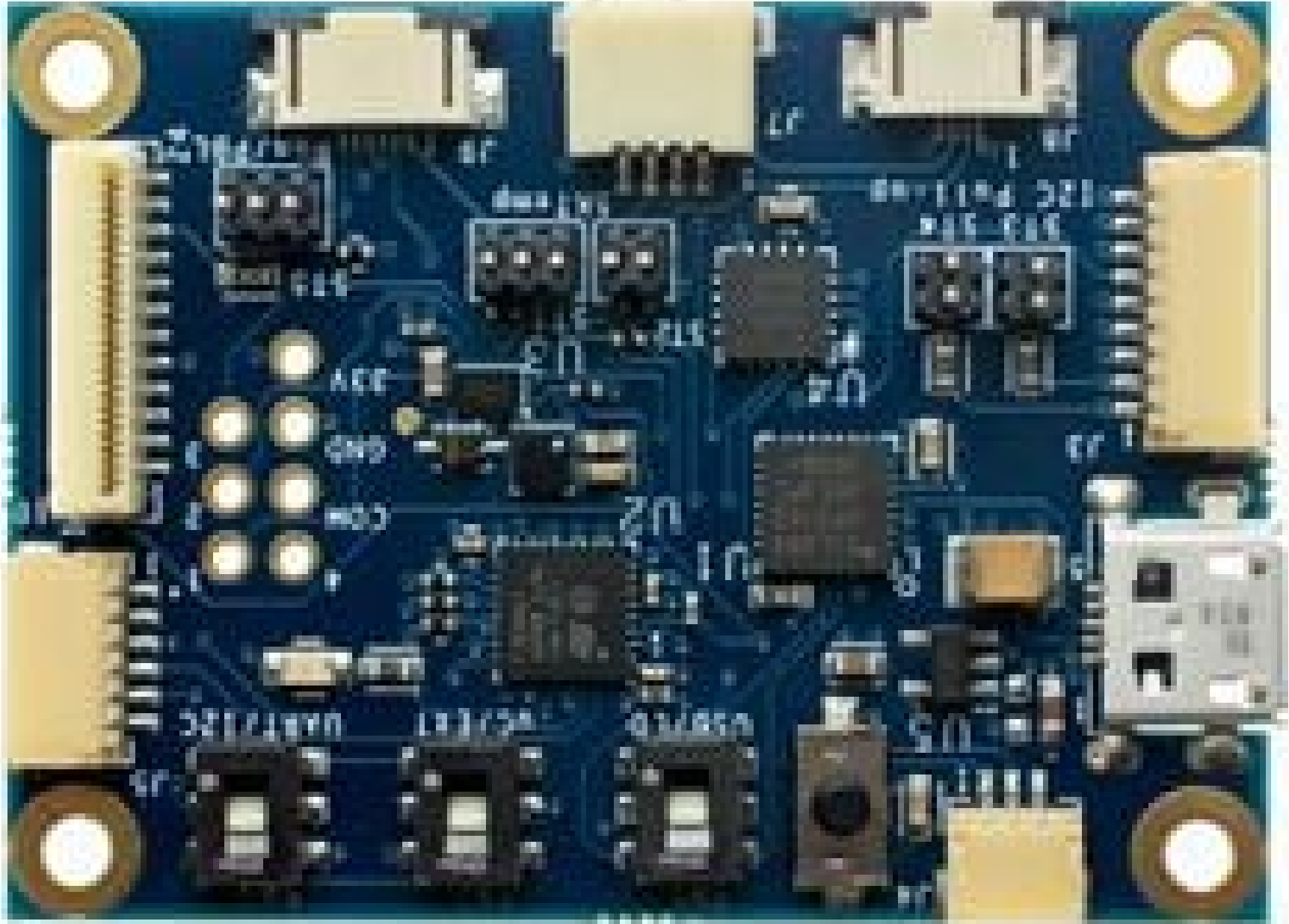
USB-MUniversal Driver Board