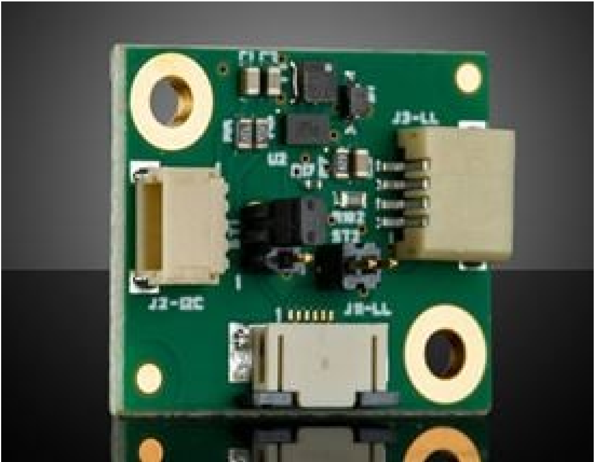
Corning® Varioptic® Variable Focus Liquid Lens Driver Board with Maxim MAX14574 Driver and I2C/DC Input