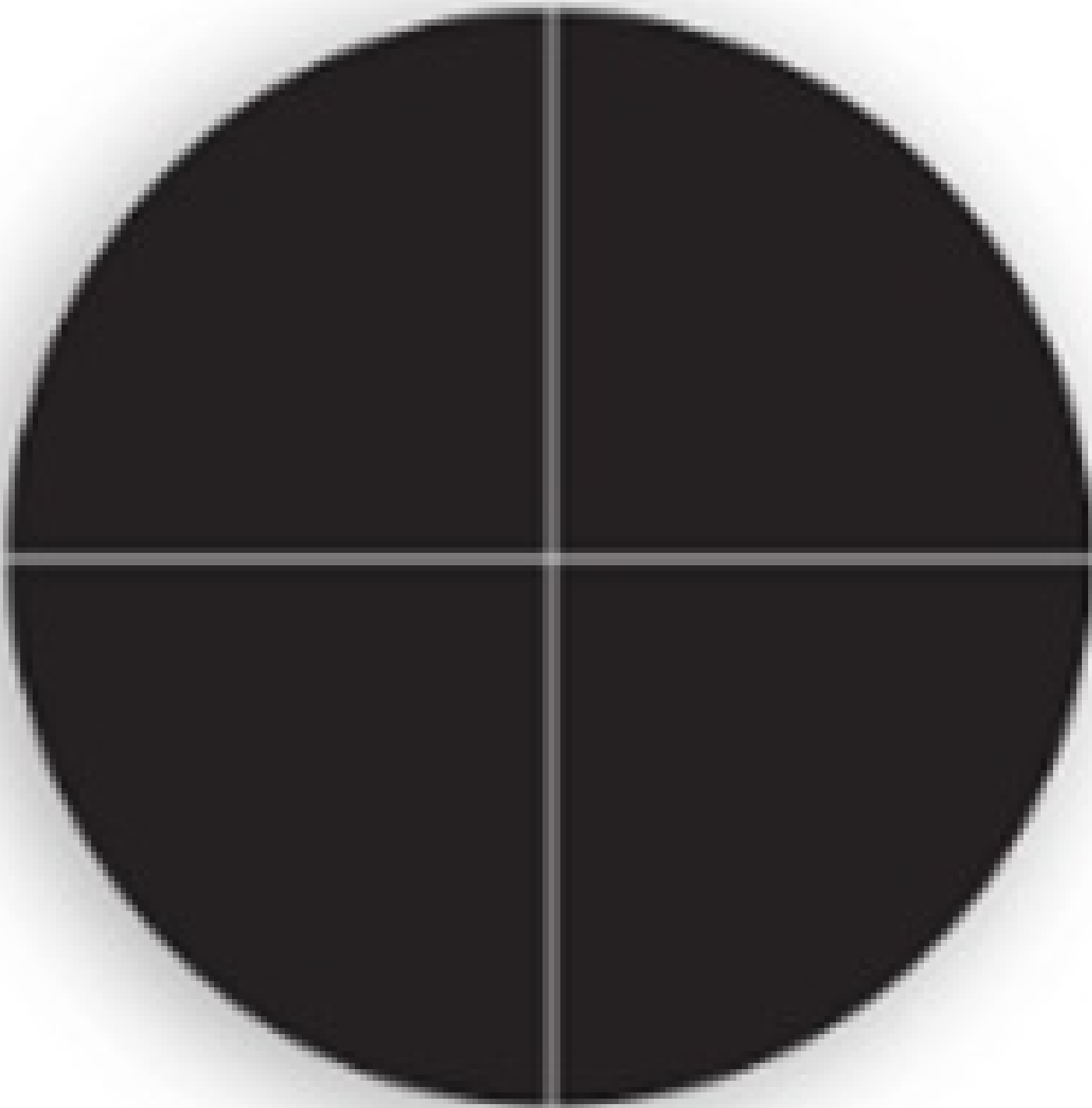
#88-519: Crosshair Reticle for Pattern Projectors