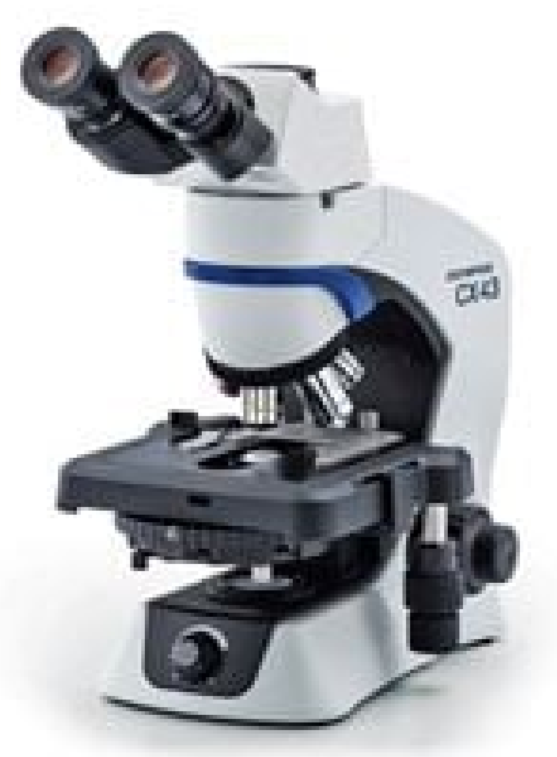
Image shown is full assembly. Each component sold separately. See Technical Information tab for additional details.