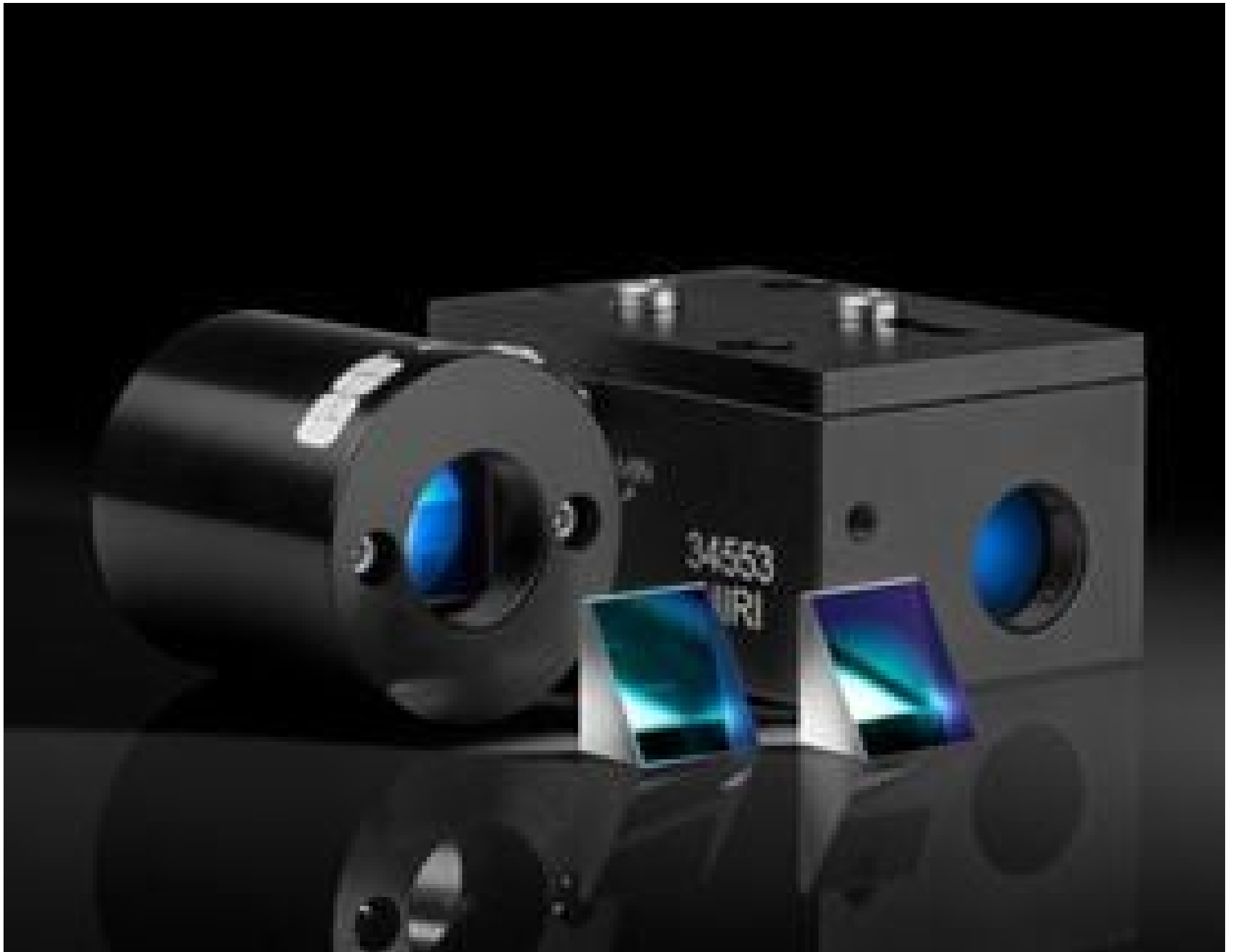
TECHSPEC Anamorpische Prismenpaare