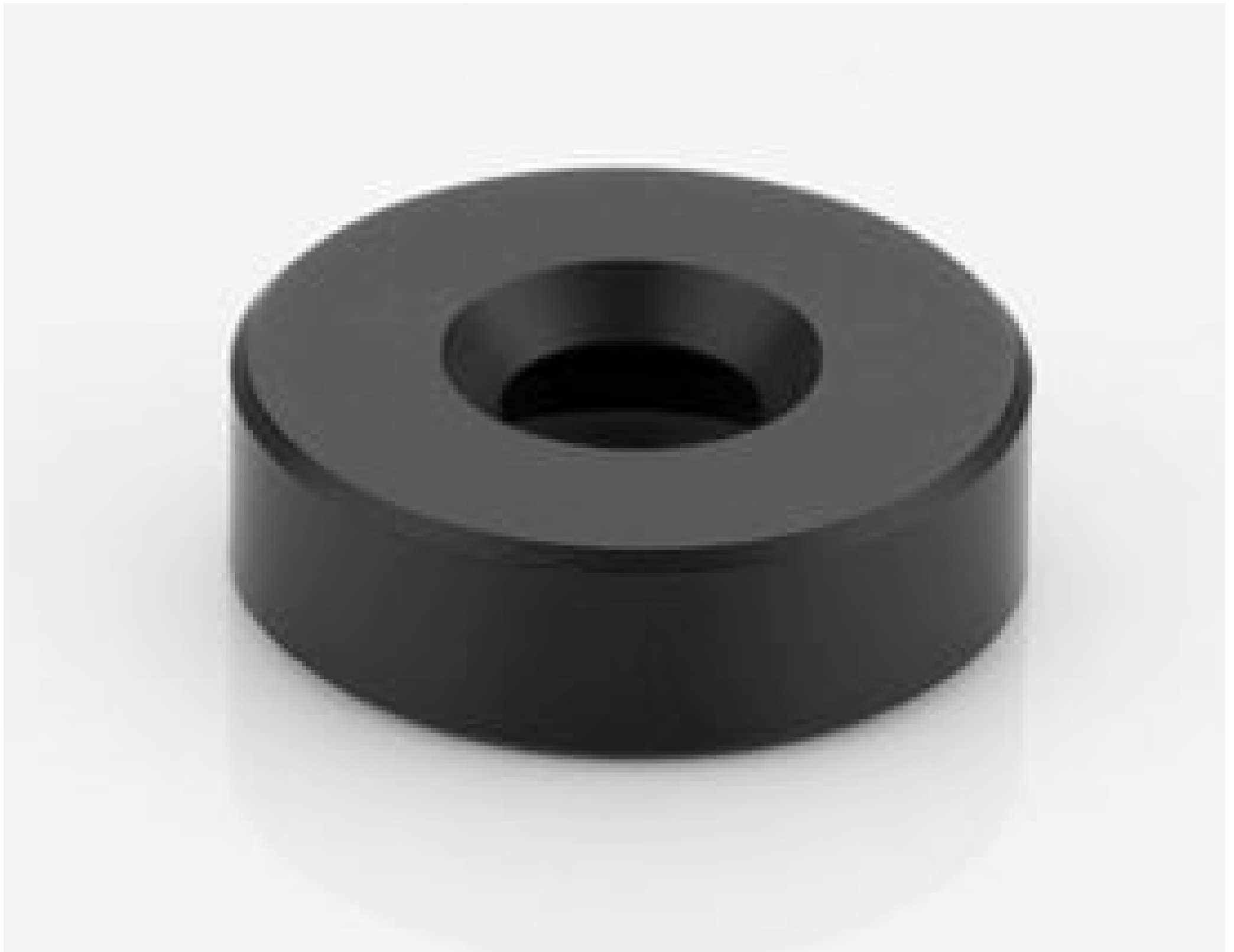
Filter Holder for 50mm Cx Lens (representative photo). Filter Holder varies by stock number. View PDF drawing for additional information.