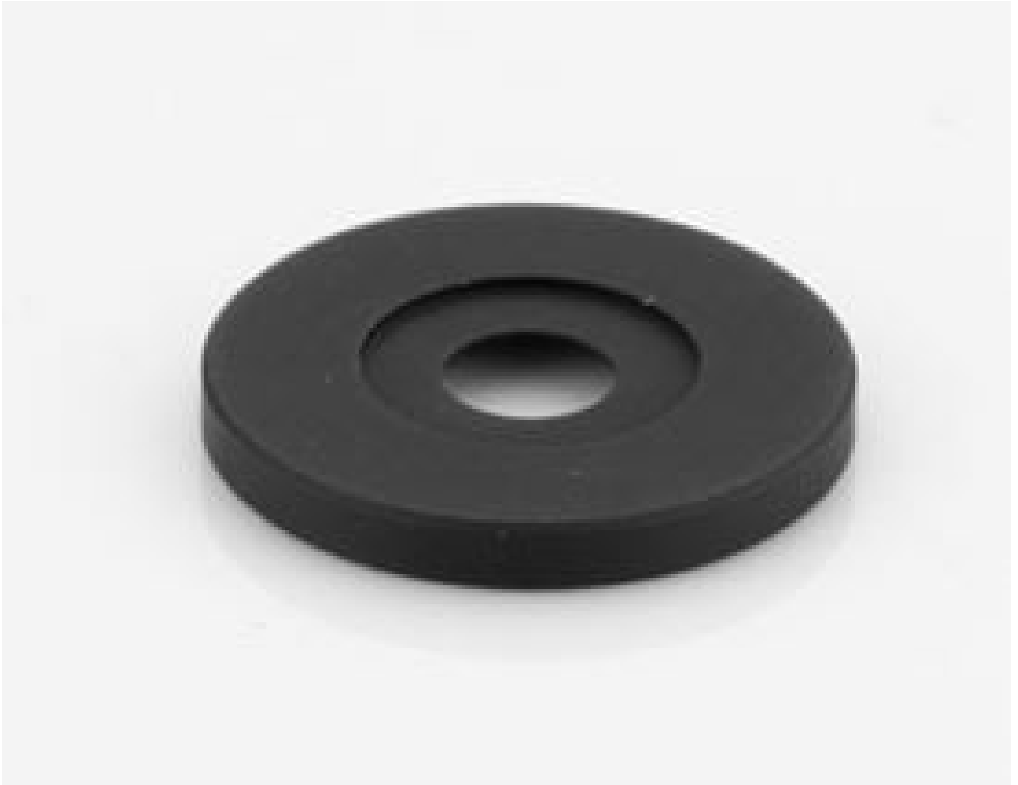
Aperture for Cx Lens (representative photo). Aperture varies by stock number. View PDF drawing for additional information.